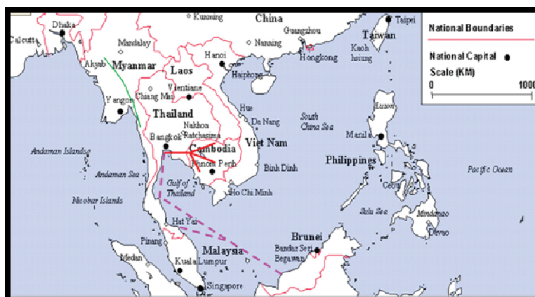
Rajah 2 Pergerakan mangsa pengeksploitasian pekerja di BPTT

Selain daripada itu, ada dakwaan yang menyatakan bahawa mangsa-mangsa ini telah disuntik dengan dadah dan apabila tersedar telah berada di atas BPTT di laut dan kemudiannya mangsa diberitahu bahawa mereka telah berhutang antara 15000 – 20,000 Baht kepada ejen dan perlu ditebus dengan kerja paksa tanpa gaji. Kes-kes sebegini yang kerap ditemui oleh APMM apabila menjalankan tugas menjaga perairan negara terutama di Wilayah Maritim yang telah dizonkan (APMM, 2009).