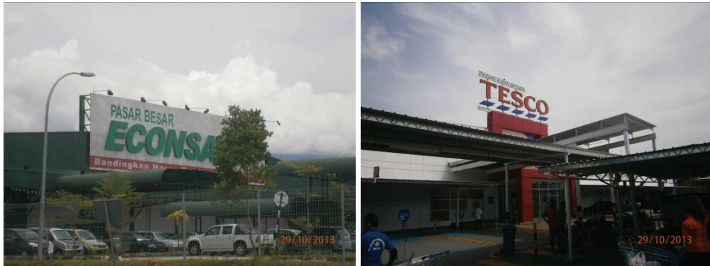
Rajah 3 Pasar raya besar di Kawasan Kajian

Selain itu, kewujudan penawaran fungsi-fungsi ekonomi moden yang lain seperti ejen insurans/takaful, ejen tiket, syarikat kurier serta hotel pada jumlah yang memuaskan merupakan petunjuk awal bahawa kawasan kajian sedang menerima limpahan globalisasi ekonomi dari kawasan teras wilayah metropolitan.