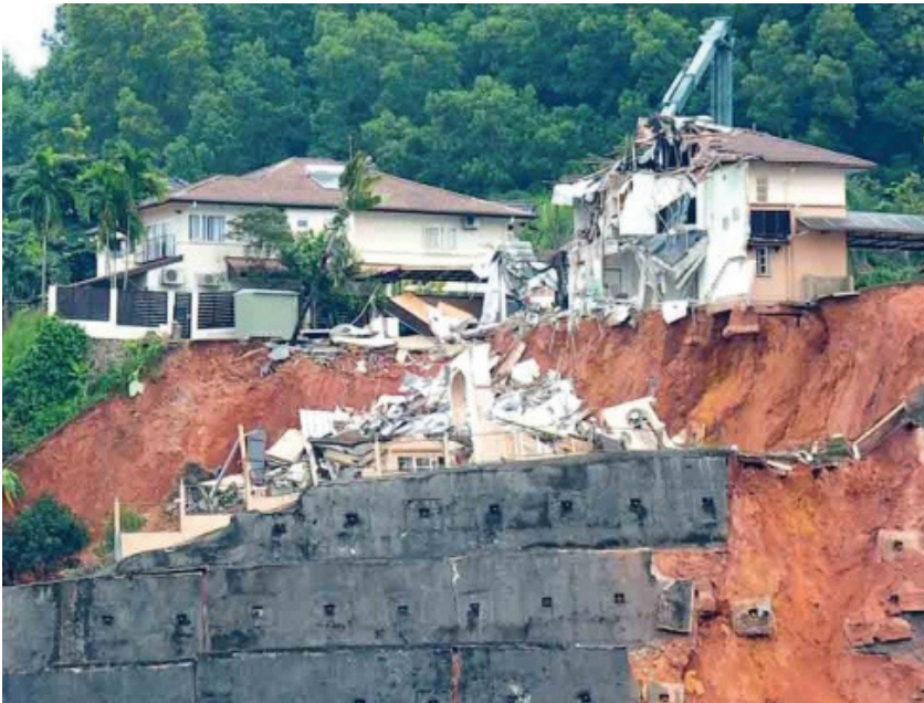
Rajah 2 Runtuhan di Puncak Setiawangsa Kuala Lumpur, Malaysia

sesetengah negara bencana tanah runtuh dikategorikan sebagai bencana sekunder ( secondary disaster ) yang mana ia dicetuskan susulan daripada kejadian seperti gempa bumi dan juga taufan.