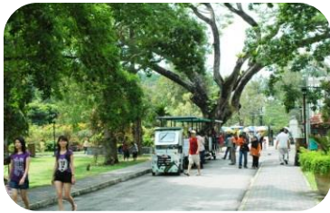
Foto 1. Perkhidmatan 'tram'