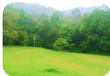
Foto 4. Kawasan padang rumput yang luas