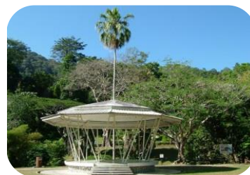
Foto 5. Antara tempat berehat yang disediakan