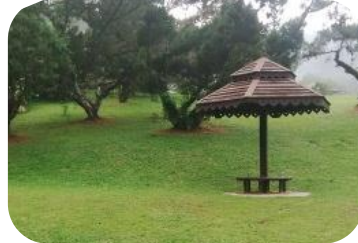
Foto 2. Pondok kecil yang terdapat di sekitar taman