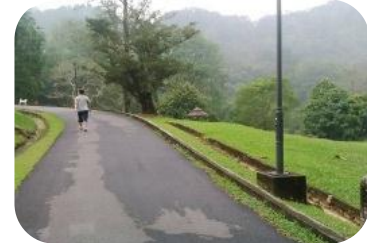
Foto 3. Trek pejalan kaki / jogging