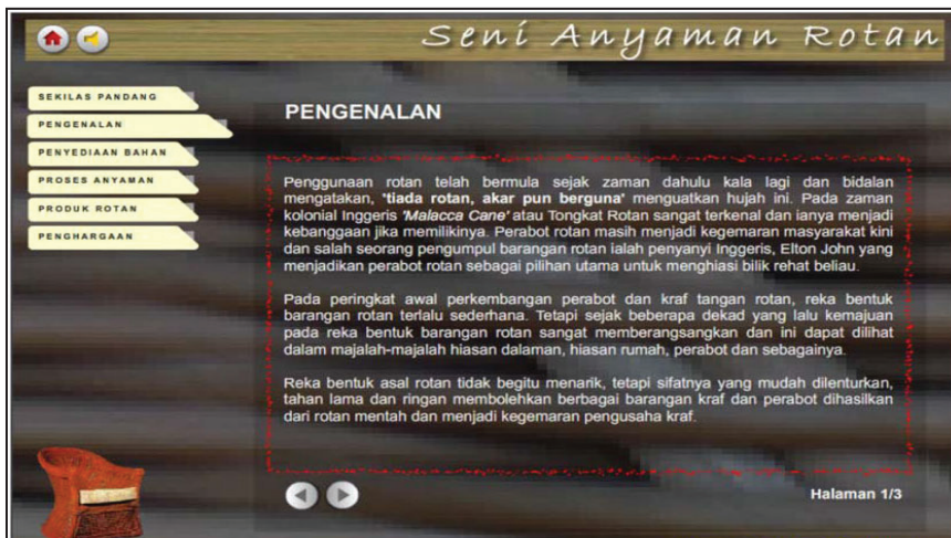
Rajah 3 Sub menu dalam Modul Seni Anyaman Rotan

Bagi setiap modul yang memaparkan setiap jenis anyaman (Modul Seni Anyaman Berasaskan Buluh, Modul Seni Anyaman Berasaskan Mengkuang, Modul Seni Anyaman Berasaskan Rotan), terdapat empat sub modul yang terdiri daripada Sub Modul Pengenalan, Sub Modul Penyediaan Bahan, Sub Modul Proses Anyaman dan Sub Modul Contoh Produk Anyaman. Rajah 3 menunjukkan contoh sub menu dalam Modul Seni Anyaman Rotan.