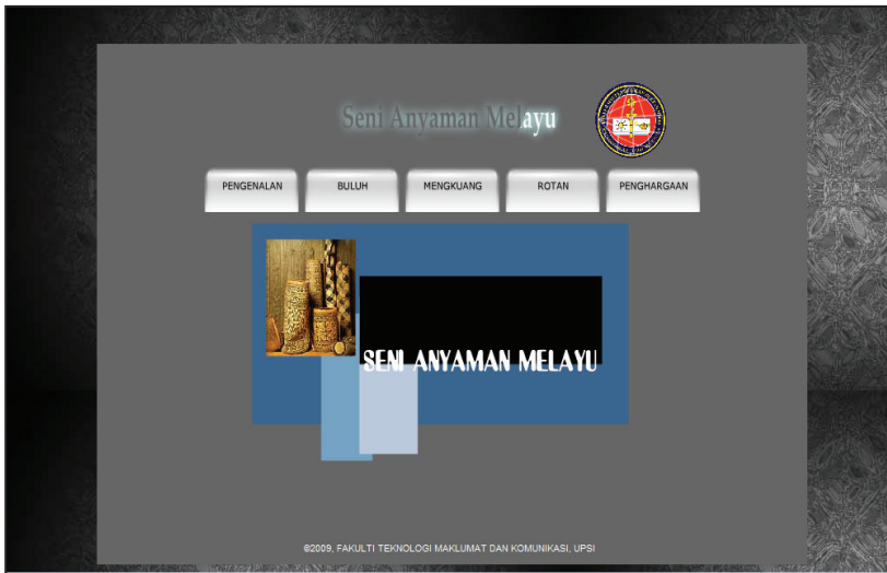
Rajah 2 Menu Utama Perisian Multimedia Interaktif : Seni Anyaman Melayu

Bagi setiap modul yang memaparkan setiap jenis anyaman (Modul Seni Anyaman Berasaskan Buluh, Modul Seni Anyaman Berasaskan Mengkuang, Modul Seni Anyaman Berasaskan Rotan), terdapat empat sub modul yang terdiri daripada Sub Modul Pengenalan, Sub Modul Penyediaan Bahan, Sub Modul Proses Anyaman dan Sub Modul Contoh Produk Anyaman. Rajah 3 menunjukkan contoh sub menu dalam Modul Seni Anyaman Rotan.