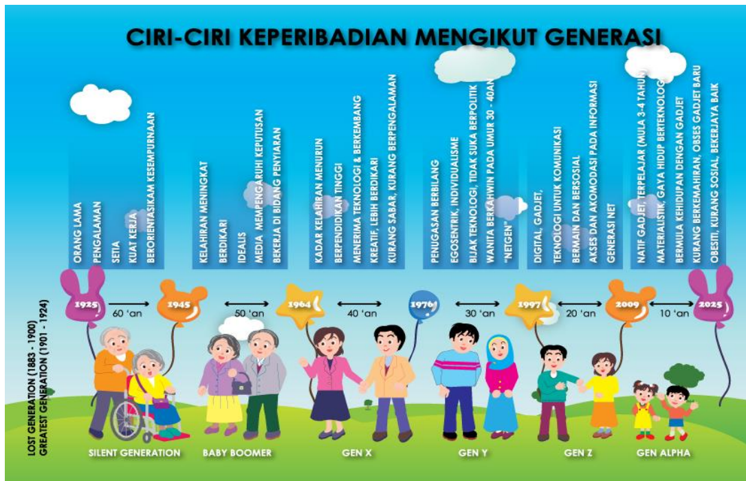
Rajah 1: Ciri-ciri keperibadian mengikut generasi (Muhammad, Maizatul & Suhairun, 2018)

Di Malaysia, generasi kanak-kanak membesar berkait rapat dengan situasi yang berlaku dalam kalangan masyarakat yang melibatkan perkembangan masyarakat Malaysia yang mempunyai ciri-ciri yang berbeza berbanding kajian Howe dan Strauss (2000). Misalnya era industri British, Perang Jepun, Merdeka, 13 Mei, Pasca Dasar Ekonomi Baru (DEB), Reformasi, Malaysia Baharu dan penularan virus Corona yang sedikit sebanyak telah membentuk norma baharu kehidupan. Rajah 1 menggambarkan pembahagian generasi mengikut tahun kelahiran dan ciri-ciri keperibadian mengikut generasi (Muhammad, Maizatul & Suhairun, 2018).