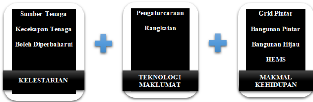
Rajah 1: Integrasi tiga bahagian utama pendidikan SD

Rajah 1 menunjukkan blok merah yang berkaitan dengan kelestarian dalam konteks kajian ini yang merujuk kepada kecekapan tenaga dan sumber tenaga yang dapat diperbaharui. Blok kuning pula berkaitan dengan program pengajian Sarjana Muda Pendidikan Teknologi Maklumat ( information technology @ IT ) yang terlibat dalam konteks kajian ini dengan menumpukan kepada dua modul khusus yang dipilih iaitu pengaturcaraan dan rangkaian. Blok hijau berkaitan dengan makmal kehidupan yang mana dalam konteks kajian ini ianya merujuk kepada grid pintar, bangunan pintar, bangunan hijau dan HEMS.