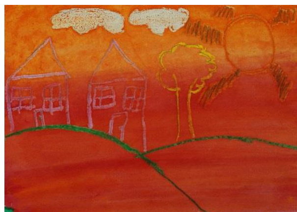
Ilustrasi 4: Pemandangan Petang (4)