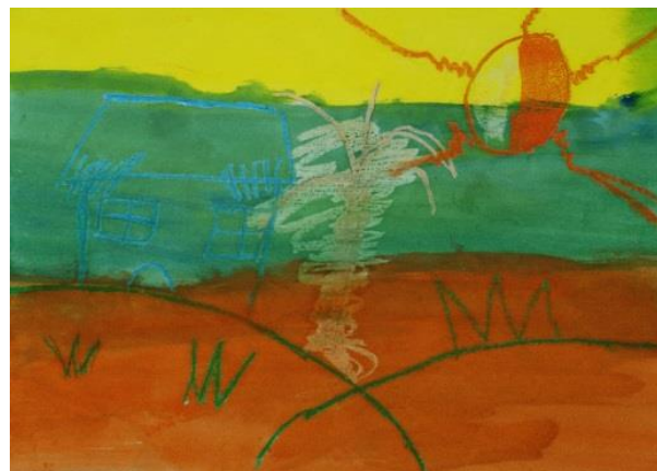
Ilustrasi 6: Pemandangan Petang (6)

Dapatan daripada tugas bertajuk ‘Pemandangan Petang’ mendapati semua MMP tidak dapat menyiapkan tugas mengikut masa yang ditetapkan. Murid diberikan masa tambahan bagi menyiapkan tugas. Perkara ini disebabkan MMP kurang berkeyakinan menghasilkan tugas tanpa bantuan guru. Penerangan dan demonstrasi diberikan berkali-kali bagi menambahkan keyakinan murid menghasilkan tugas yang diberikan.