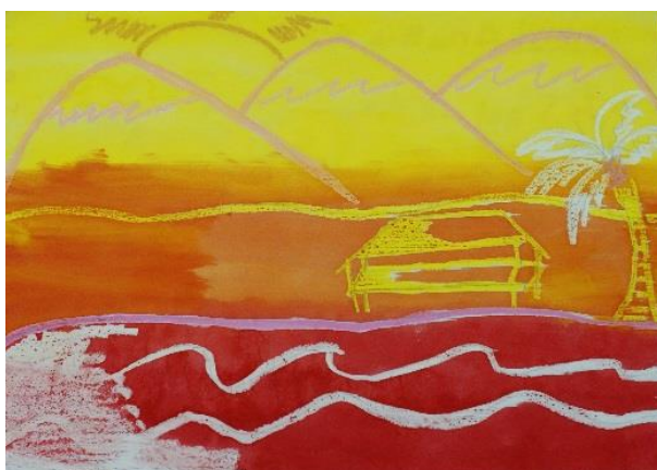
Ilustrasi 2: Pemandangan Petang (2)