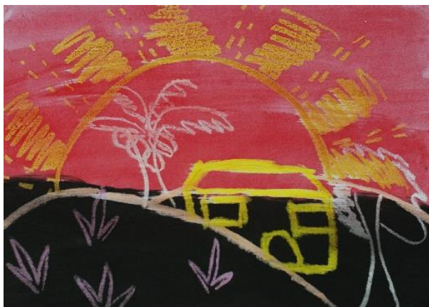
Ilustrasi 5: Pemandangan Petang (5)