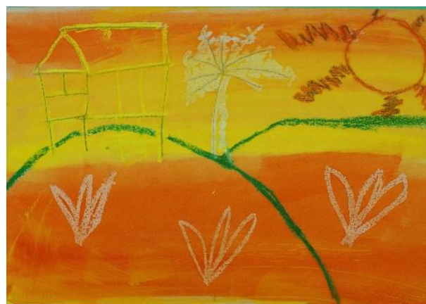
Ilustrasi 3: Pemandangan Petang (3)