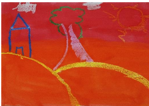
Ilustrasi 1: Pemandangan Petang (1)