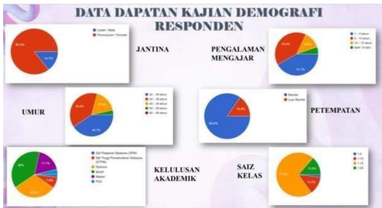
Rajah 1: Taburan Demographi Responden

Dapatan kajian ini dibahagikan kepada empat bahagian iaitu Bahagian A akan memperincikan tentang latar belakang responden. Bahagian B pula menjelaskan tentang persepsi pengajaran pendekatan belajar melalui bermain di tadika swasta Selangor. Bahagian C pula memperincikan tentang masalah yang dihadapi dan bahagian D adalah mengenai cabaran yang dihadapi oleh pendidik tadika swasta semasa menjalankan aktiviti melalui pendekatan belajar melalui bermain.