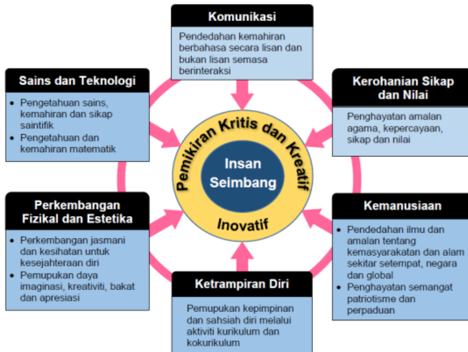
Rajah 1: Kerangka Kurikulum Standard Prasekolah Kebangsaan

KSPK (Semakan 2017) digubal berdasarkan prinsip amalan bersesuaian dengan perkembangan kanak-kanak dan teori pembelajaran kanak-kanak. Kandungan KSPK (Semakan 2017) adalah berasaskan enam tunjang iaitu Tunjang Komunikasi; Kerohanian, Sikap dan Nilai; Kemanusiaan; Perkembangan Fizikal dan Estetika; Sains dan Teknologi; dan Keterampilan Diri. Enam tunjang tersebut merupakan domain utama yang menyokong antara satu sama lain dan disepadukan dengan pemikiran kritis, kreatif dan inovatif. Kesepaduan ini bertujuan membangunkan modal insan yang menghayati nilai-nilai murni berteraskan keagamaan, berpengetahuan, berketerampilan, berpemikiran kritis dan kreatif serta inovatif sebagaimana yang digambarkan dalam Rajah 3.1 di bawah.