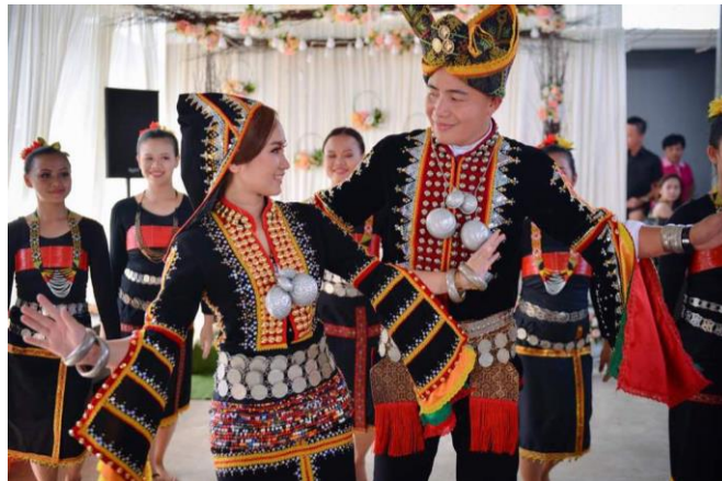
Rajah 2: Imej Pakaian Sinipak.

Pakaian sinipak mempunyai keunikan dan keindahan yang tersendiri melalui sulaman manik yang membentuk motif dan corak pada ragam hias sinipak . Kemahiran menyulam yang dimiliki oleh pembuat pakaian menjadikan sinipak sebagai salah satu kostum terkenal di negeri Sabah. Cara untuk menghasilkan pakaian sinipak adalah sangat rumit dan memerlukan kesabaran dan peralatan yang mahal. Justeru itu, pakaian tradisional ini tidak mampu dimiliki oleh setiap orang. Walau bagaimanapun, pada biasanya pemilik dan pembuat pakaian sinipak mempunyai koleksi yang banyak dan mereka menyediakan perkhidmatan sewaan.