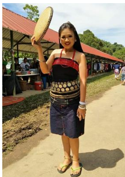
Rajah 1: Imej Pemakaian Sunduk .

Secara tradisinya, masyarakat Dusun Tindal mempunyai kemahiran yang tinggi dalam menghasilkan kraf tangan seperti anyaman dan sulaman pakaian. Kraf tangan anyaman biasanya menggunakan bahan alam semula jadi seperti kulit kayu, rotan, bambu dan kayu. Manakala kraf sulaman dihasilkan untuk membuat pakaian tradisional. Kearifan masyarakat Dusun Tindal dalam menghasilkan pakaian tradisional merupakan satu amalan yang diwarisi. Penghasilan pakaian tradisional wanita iaitu, sinipak dan rinagang mestilah lengkap dengan perhiasannya termasuk penghasilan sunduk .