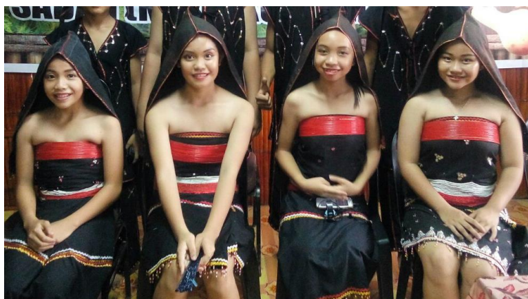
Rajah 7: Imej Sunduk pada Pakaian Rinagang

Rajah 7, menunjukkan imej pemakaian surunduk pada pakaian rinagang . Sunduk atau surunduk diperbuat daripada kain berwarna hitam yang disulam dengan benang berwarna merah dan kuning serta manik-manik yang disusun secara melintang dan menegak membentuk corak geometri. Pemakaian sunduk sebagai hiasan kepala bertujuan untuk menambah seri wajah si pemakai.