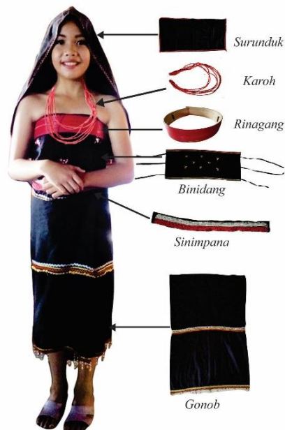
Rajah 6 Struktur Pakaian dan Perhiasan Rinagang

Masyarakat Dusun Tindal juga menggelarkan wanita bujang sebagai aragang atau merah dan bererti wanita bujang. Pemakaian rinagang juga menjadi tanda kecantikan seseorang wanita Dusun Tindal. Oleh itu, rinagang telah menjadi panggilan pada kostum tradisional Tindal yang diguna pakai sehingga hari ini.