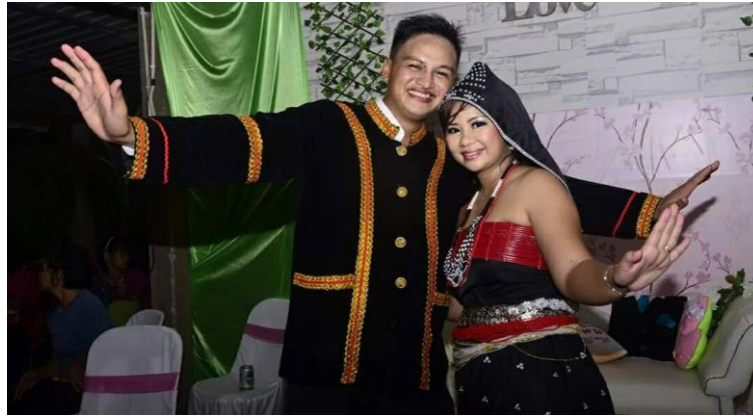
Rajah 5: Imej Pakaian Rinagang .

Rajah 5, menunjukkan imej pakaian rinagang yang dipakai oleh pengantin wanita yang dirakam semasa menarikan tarian sumazau . Pakaian rinagang menunjukkan reka bentuk dan aksesori yang menarik. Salah satu aksesori pakaian rinagang adalah surunduk atau sunduk yang dipakai oleh pengantin wanita. Sunduk dipakai oleh pengantin wanita sebagai penambah seri kecantikannya.