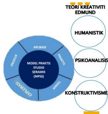
Rajah 1: Model Praktis Studio Seramik bersandarkan kepada teori Edmund Sumber: Penggunaan tanah liat alternatif dalam pembentukan kreativiti terhadap model praktis studio seramik, Shariff M.S (2021)