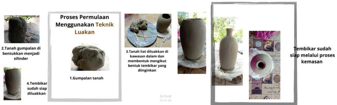
Rajah 2: Karya DA13 2D kepada 3D MSK 3042 UPSI, 2021

dapat melambangkan identiti warisan Melayu dalam penghasilan karya kreatif beradaptasikan terhadap penggunaan tanah liat alternatif.