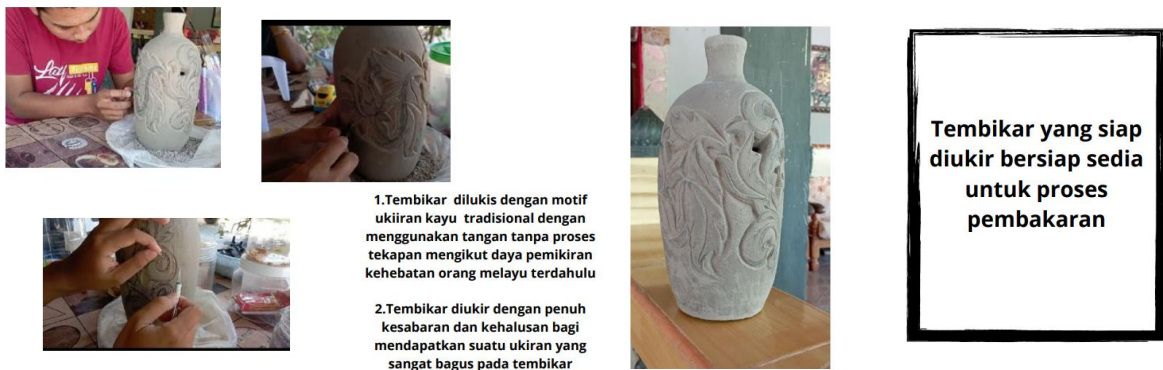
Rajah 3: Proses Kekemasan DA13 MSK 3042 UPSI, 2021

Pada peringkat ini, selepas responden memperoleh sumber tanah liat alternatif. Responden menggunakan tanah liat alternatif tersebut sebagai bahan utama dalam penghasilan produk. Di mana responden menghasilkan karya daripada bentuk 2D kepada 3D. Hasil yang reka seharusnya mengetengahkan identiti warisan Melayu. Proses penghasilan ini mengambil tempoh masa tertentu alam mengawal keadaan tanah liat alternatif berada dalam keadaan yang baik sehingga ke peringkat akhir iaitu kekemasan dan “finishing”.