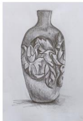
Lakaran idea baharu yang dipilih