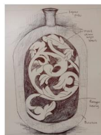
Lakaran idea asal