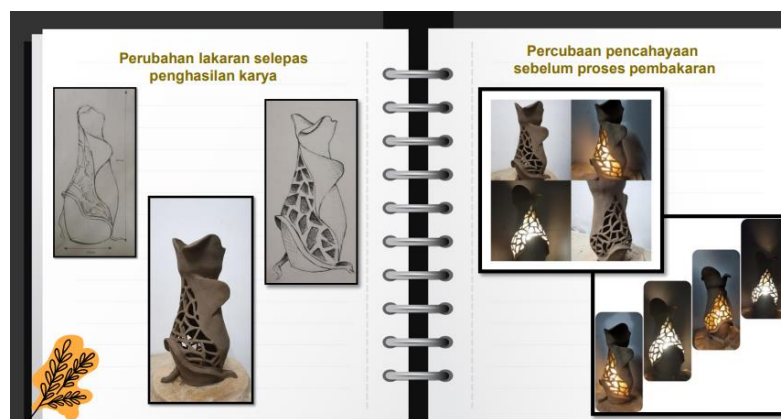
Rajah 4: Karya terbaik DA12 MSK 3042 UPSI, 2021

Penghasilan karya yang dihasilkan oleh reposnden menunjukkan tahap keberhasilan dalam menerapkan simbolik warisan Melayu itu berjaya. Dimana responden berjaya mengadaptasikan seni kraf bersama ukiran. Responden menitikberatkan bentuk karya dalam reka corak yang lebih berorientasikan kepada simbolik kraf tanah air. Hal ini menunjukkan tahap penggunaan dan adaptasi penggunaan tanah liat alternatif terhadap penghasilan karya kreatif bersandarkan warisan Melayu berjaya dihasilkan dengan penuh konsep elemen dan prinsip rekaan. Keberhasilan ini membuktikan tahap penggunaan tanah liat warisan berjaya diadaptasikan dengan bersandar prosedur khusus iaitu model praktis studio seramik. Hal ini terbukti, keberhasilan penggunaan tanah liat alternatif dalam penghasilan karya kraf. Terbuktilah bahawa pada penghasilan seramik terdahulu juga mempunyai prosedur yang sama namun ia tertumpu pada kawasan tertentu seperti Kuala Kangsar, Kuala Tembeling dan Kuala Krai sahaja. pada penghasilan seramik