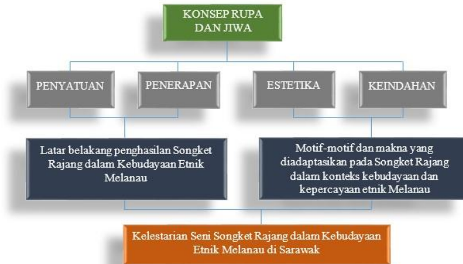
Rajah 1: Gambar Kerangka Konseptual yang telah diadaptasikan melalui Konsep Rupa dan Jiwa oleh Syed Ahamd Jamal.

Kajian ini menggunakan kaedah kualitatif dengan menggunakan pendekatan etnografi dimana pengkaji akan turun ke kajian lapangan di Pusat Tenunan Songket Kampung Rajang, 96150 Belawai, Mukah, Sarawak dalam konteks kebudayaan dan kepercayaan yang diadaptasikan dalam Songket Rajang. Dalam penyelidikan ini, pengkaji akan meneliti satu kelompok budaya atau masyarakat dalam konteks situasi sebenar dan melibatkan satu tempoh masa yang berpanjangan. Pendekatan ini memberikan kefahaman tentang asal usul sesuatu penghasilan songket pada masa kini. Pengkaji menggunakan kaedah temubual secara semi berstruktur, ini kerana memudahkan pengkaji untuk mendapatkan dapatan yang lebih sahih berkenaan apa yang dikaji. Seramai 11 orang informan akan ditemubual dalam mendapatkan maklumat yang dikehendaki. Kajian ini turut berlandaskan satu kerangka konseptual iaitu Konsep Rupa dan Jiwa oleh Syed Ahmad Jamal (1992).