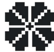
Gambar 14: Motif Tempuk Manggis