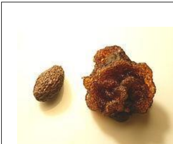
Gambar 21: Moif Bunga Kembang Semangkuk

Motif Manis-manis Sayang dalam songket Etnik Melanau merujuk kepada corak yang memaparkan unsur-unsur seni yang melambangkan kelembutan, keanggunan, dan kemesraan. Corak ini umumnya dihiasi dengan bunga yang indah dan motif yang menggambarkan kehalusan dalam seni tenunan. Motif Manis-manis Sayang membawa kesan penuh kasih sayang dan kehangatan, serta memberikan nilai estetika yang memukau pada kain songket Etnik Melanau. Dalam proses penghasilan Motif Manis-manis Sayang ini, terdapat dua jenis motif bunga yang digunakan, iaitu Bunga Kembang Semangkuk dan Bunga Tanjung. Berikut adalah ilustrasi gambar untuk memberikan gambaran yang lebih jelas tentang keunikan motif yang dihasilkan dalam Motif Manis-manis Sayang.