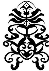
Gambar 9: Motif Bunga Cempaka