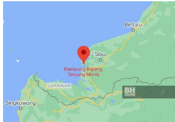
Gambar 4: Peta Kawasan Etnik Melanau, Sarawak di Pesisiran Laut

orang yang berada di atas. Terdapat dalam suku etnik Melanau yang beragama Islam dan Kristian, namun ada juga yang mengamalkan kepercayaan Pagan, iaitu kepercayaan animisme yang merupakan satu bentuk kepercayaan masyarakat etnik Melanau suatu ketika dahulu, yang diwarisi oleh orang terdahulu sehingga sekarang.