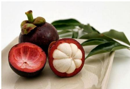
Gambar 13: Motif Tempuk Manggis

yang sama atau terinspirasi oleh hulu panah, membentuk reka bentuk yang simetri dan dinamik. Motif Tabar memberikan kesan yang unik dan berani pada kain songket, sering menjadi elemen utama dalam hiasan kain atau diterapkan secara merata di seluruh kain. Estetika motif ini mencerminkan kekuatan dan keindahan dalam seni tenunan tradisional etnik Melanau. Dalam pembuatan songket motif Tabar, terdapat tiga jenis motif bunga yang digunakan iaitu Motif Tempuk Manggis, Motif Bunga Melur, dan Motif Bunga Cabik, yang menjadi motif utama dalam mencipta corak penuh Songket Motif Tabar. Berikut adalah ilustrasi gambar untuk memberikan gambaran yang lebih jelas mengenai keunikan motif yang dihasilkan dalam Motif Tabar.