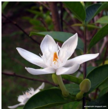
Gambar 15: Motif Bunga Melur