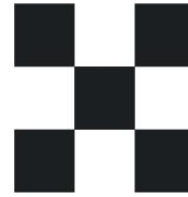
Gambar 24: Motif Bunga Tanjung