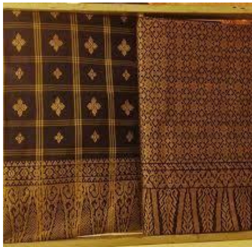
Gambar 2: Sogket Rajang Corak Bunga Tabur dan Corak Penuh

Pada 24 April 1991, sebuah kumpulan tenunan Songket Rajang telah ditubuhkan dengan keahlian seramai 19 orang. Menurut pengasas Songket Rajang, Sa'anah Suhaili, tujuan Kumpulan Tenunan Songket ini ditubuhkan adalah untuk mengetengahkan dan mempromosikan tenunan Songket Rajang di pasaran agar dapat menjadi industri Songket yang terkenal di Sarawak. Menurut beliau juga, terdapat dua jenis Songket yang dihasilkan iaitu corak penuh dan corak bunga tabur. Menurut Awangko' Hamdan et al. (2006), Brunei memainkan peranan yang amat penting pada masa itu dalam memajukan seni tekstil di Sarawak, khususnya dalam penghasilan Songket Rajang yang terkenal. Sebelum abad ke-17, pengaruh Kesultanan Melayu Brunei melibatkan seluruh pantai utara Borneo dan Kalimantan, serta seluruh Kepulauan Filipina, menyebabkan pelbagai jenis tekstil dan ragam hias terserap ke dalam seni tekstil Sarawak. Awangko' Hamdan et al. (2006) juga menyatakan bahawa di Sarawak, terdapat kain Songket yang dikenali sebagai Kain Brunei, merujuk kepada kain Songket dengan corak bunga bertabur.