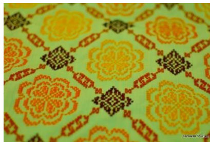
Gambar 12: Motif Tabar Songket Rajang

Motif Tabar dalam Songket Rajang merujuk kepada corak yang terinspirasi oleh bentuk atau struktur hulu panah atau anak panah. Corak ini umumnya menampilkan unsur-unsur geometrik