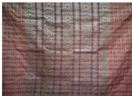
Gambar 7: Sukit Lidi Songket Rajang

Motif Sukit Lidi dalam songket Etnik Melanau merujuk kepada corak yang terinspirasi daripada struktur dan bentuk lidi atau anyaman bambu. Corak ini sering memaparkan garisan-garisan yang menyerupai atau terinspirasi oleh lidi, mencipta reka bentuk yang sederhana dan organik. Motif Sukit Lidi memberikan sentuhan alami dan tradisional kepada kain songket, dan kerap kali diaplikasikan sebagai elemen hiasan yang mencolok di beberapa bahagian kain atau keseluruhan kain, mencipta kesan yang unik dan estetik. Dalam proses pembuatan motif