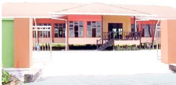
Gambar 3: Pusat Tenunan Songket Rajang