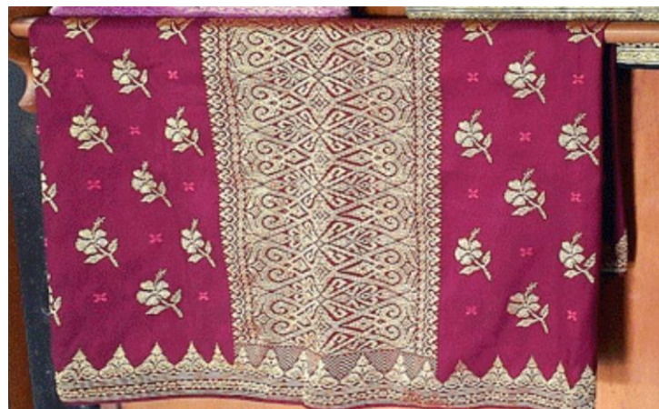
Gambar 19: Motif Manis-manis Sayang Songket Rajang

Songket Corak Bunga Tabur dalam seni Etnik Melanau merujuk kepada kain songket yang dihiasi dengan corak bunga yang tersebar atau ditebar secara rawak di seluruh permukaan kain. Corak ini menggambarkan bunga-bunga yang diatur secara rawak, menciptakan reka bentuk yang berwarna-warni dan hidup. Songket ini tidak mengikut pola tertentu, melainkan memberikan kesan yang bebas dan alami. Corak Bunga Tabur dalam songket merupakan corak yang ditunen secara tersebar dan tidak bersambung antara satu sama lain. Dalam corak ini, pengkaji dapat mengenal pasti motif tertentu, seperti Motif Manis-manis Sayang. Songket Corak Bunga Tabur membawa keindahan alam dan kreativiti, mencipta karya seni yang memikat dengan keunikan corak bunga yang tersebar di seluruh kain songket tersebut.