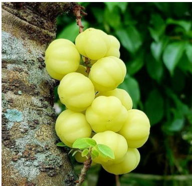
Gambar 10: Motif Bunga Cermai