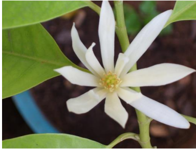
Gambar 8: Motif Bunga Cempaka

Sukit Lidi ini, terdapat dua jenis motif bunga yang digunakan, iaitu Bunga Cempaka dan Bunga Cermai. Di bawah ini terdapat ilustrasi gambar untuk memberikan gambaran yang lebih jelas terhadap motif yang dihasilkan dalam Songket Sukit Lidi.