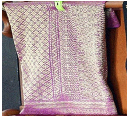
Gambar 6: Songket Corak Penuh Songket Rajang

Songket Corak Penuh Etnik Melanau merujuk kepada kain songket yang melibatkan hiasan corak penuh merentasi seluruh permukaan kain. Corak ini mencakup berbagai motif dan unsur tradisional yang mencerminkan identitas masyarakat Melanau. Kemahiran teknikal dalam tenunan memainkan peranan penting dalam mencipta kain songket ini, dengan setiap helai benang diatur dengan teliti untuk menghasilkan corak yang seragam dan cantik. Songket Corak Penuh Etnik Melanau menggambarkan keindahan dan kekayaan warisan budaya mereka melalui seni tenunan yang sarat dengan makna dan simbolisme. Sebagai contoh, Songket Cuban, juga dikenali sebagai songket corak penuh yang disulam dengan benang emas atau perak, dihasilkan melalui proses penenunan yang melibatkan keseluruhan kain. Corak ini biasanya ditempatkan di bahagian utama reka bentuk kain, terutamanya pada badan kain yang umumnya dihiasi dengan benang emas. Dua motif yang dikenalpasti dalam corak ini ialah Motif Sukit Lidi dan Motif Tabar.