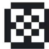
Gambar 11: Motif Bunga Cermai