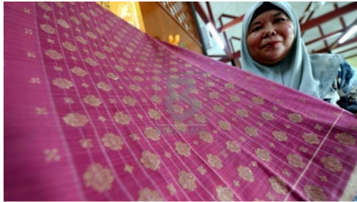
Gambar 20: Songket Corak Bunga Tabur Songket Rajang yang berusia 100 tahun

Motif Manis-manis Sayang dalam songket Etnik Melanau merujuk kepada corak yang memaparkan unsur-unsur seni yang melambangkan kelembutan, keanggunan, dan kemesraan. Corak ini umumnya dihiasi dengan bunga yang indah dan motif yang menggambarkan kehalusan dalam seni tenunan. Motif Manis-manis Sayang membawa kesan penuh kasih sayang dan kehangatan, serta memberikan nilai estetika yang memukau pada kain songket Etnik Melanau. Dalam proses penghasilan Motif Manis-manis Sayang ini, terdapat dua jenis motif bunga yang digunakan, iaitu Bunga Kembang Semangkuk dan Bunga Tanjung. Berikut adalah ilustrasi gambar untuk memberikan gambaran yang lebih jelas tentang keunikan motif yang dihasilkan dalam Motif Manis-manis Sayang.