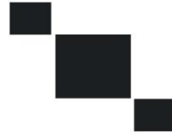
Gambar 18: Motif Bunga Cabik