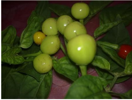
Gambar 17: Motif Bunga Cabik