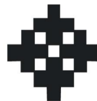
Gambar 16: Motif Bunga Melur Sumber dari Penyelidik