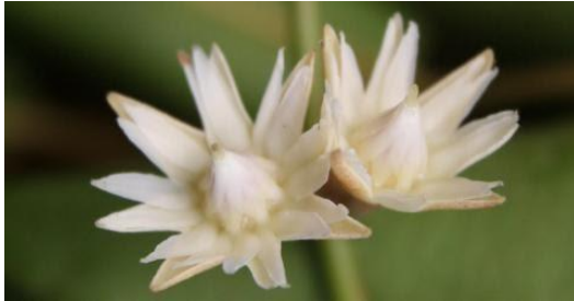
Gambar 23: Motif Bunga Tanjung