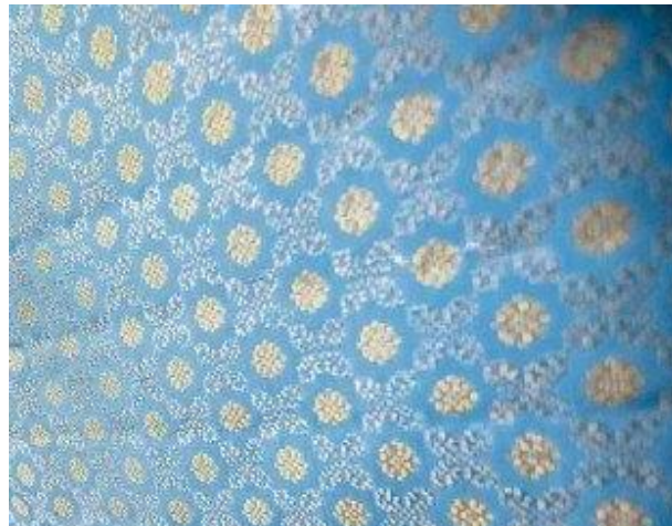
Gambar 1: Songket Rajang Motif Corak Penuh

Etnik Melanau yang mendiami kawasan Lembah Utara, terutamanya di Kampung Rajang, Belawai, dan Mukah, Sarawak, terkenal dengan kraf tenunan songket yang diwarisi sejak zaman dahulu. Songket Rajang, yang memiliki nilai setanding dengan songket dari negeri-negeri lain, bukan sahaja menjadi sumber ekonomi tetapi juga pakaian eksklusif yang digunakan dalam majlis-majlis rasmi dan perkahwinan. Kaum Melanau menganggap kraf ini sebagai warisan yang perlu diteruskan dan mempraktikannya dengan menyesuaikan motif dan corak mengikut permintaan pelanggan, memastikan keunikan setiap tenunan. Walaupun industri tenunan ini kini menggunakan teknologi moden, ia tetap mengekalkan teknik tradisional untuk memelihara keaslian dan kualiti songket. Awangko' Hamdan (2006) menyatakan bahawa Songket Rajang bukan sahaja simbol penting warisan budaya, menggabungkan pengaruh sejarah Kerajaan Majapahit dan tradisi Islam Brunei, tetapi juga mencerminkan usaha berterusan untuk menghidupkan semula industri ini melalui kursus, bimbingan, dan sokongan pemasaran. Usaha ini bertujuan untuk memastikan warisan tenunan tradisional ini diteruskan oleh generasi akan datang dan terus mengukuhkan identiti etnik Melanau.