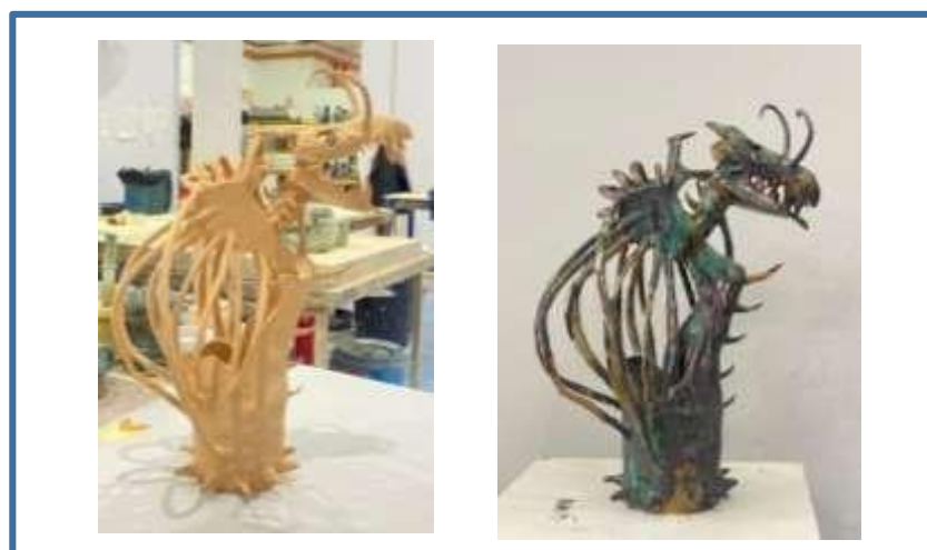
Gambar 3: Pengaplikasian & Rekacorak

Hasil karya kraf seramik yang ditunjukkan merupakan keberhasilan dan kejayaan tahap pengaplikasian teknik asas dan eksplorasi terhadap penyelidikan yang merupakan salah satu asas utama dalam model praktis studio seramik. Penggunaan reka corak dan pengaplikasian teknik asas berjaya mewujudkan kontra dan penegasan dalam penghasilan karya kreatif. Unsur seni dan prinsip rekaan diciptakan dalam struktur dan penghasilan seramik kreatif ini secara tidak lansung ia menimbulkan kesan estetika yang unik. Hal ini membuktikan kejayaan pembentukan kreativiti artistik dalam kalangan pengkarya berjaya di wujudkan tanpa sedar dan sedar melalui model praktis studio seramik. Berdasarkan kajian penyelidikan Geran KPT 2020 dibawah Prof Dr Tajul Shuhaizam Said berjaya membuktikan penggunaan tanah liat alternatif iaitu dapat diaplikasikan semula dengan adanya model praktis studio seramik.