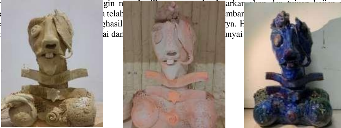
Gambar 2: Pengaplikasian terhadap Kajian Penyelidikan

Kejayaan ini mesti bermula dengan keinginan dan minat sehingga penghasilan karya mula beradaptasi dengan teknik asas dan eksplorasi terhadap penyelidikan yang merupakan salah satu asas utama dalam model praktis studio seramik. Penggunaan reka corak dan pengaplikasian teknik asas berjaya mewujudkan kontra dan penegasan dalam penghasilan karya kreatif. Unsur seni dan prinsip rekaan diciptakan dalam struktur dan penghasilan seramik kreatif ini secara tidak lansung ia menimbulkan kesan estetika yang unik. Hal ini membuktikan kejayaan pembentukan kreativiti artistik dalam kalangan pengkarya berjaya di wujudkan tanpa sedar dan sedar melalui model praktis studio seramik. Berdasarkan kajian penyelidikan Geran KPT 2020 dibawah Prof Dr Tajul Shuhaizam Said berjaya membuktikan penggunaan tanah liat alternatif iaitu dapat diaplikasikan semula dengan adanya model praktis studio seramik.