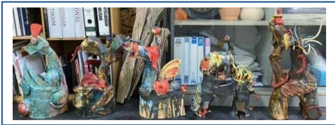
Gambar 6: Karya Kreatif dan Style yang Diaplikasikan

Gambar diatas menunjukkan tahap kejayaan penghasilan karya seramik kontemporari berasaskan penggunaan glaze dan model praktis studio seramik yang diaplikasikan dalam pembentukan kreativiti artistik berjaya. Diaplikasikan dalam bentuk arca seramik. Teknik dan style pengkarya mula wujud dan menjadi salah satu lambang dan identiti khusus. Hal ini disebabkan oleh dasar utama dalam kejayaan ini pengiat perlu memahami 5 asas utama model praktis studio seramik dan lalui fasa-fasa penuh cabaran. Selepas berjaya memecahkan dan mencari solusi dan jalan penyelesaian. Pengkarya akan berjaya untuk merancang dan merangka strategi dalam proses penghasilan karya mengikut acuan dan kajian yang dijalankan.