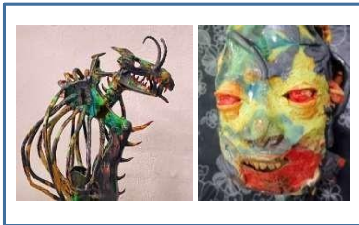
Gambar 4: Kesan Glazing

Penghasilan karya dan reka corak juga menunjukkan kesan hasil inkuiri dan penyelidikan yang dikaji serta percubaan di peringkat eksplorasi, aplikasi, praktis dan teknik menyebabkan produk yang dihasilkan menarik dan berani. Hasil yang dipamerkan ini menunjukkan keunikan dan kreativiti artistik mula terbentuk dari sudut pandangan dan kajian. Hal ini telah membantu dan mewujudkan simbolik dan lambang identiti sebuah pengkarya untuk dikenali. Penggunaan teknik asas juga dapat digabungkan dengan adanya kajian lakaran perkembangan dan olah idea sehingga pengiat berani mengaplikasikan teknik yang sukar menjadi keutamaan. Keberanian dalam mengaplikasikan penggunaan teknik dan gaya telah memberi satu impak yang positif dalam penghasilan karya yang unik dan bermampu saing. Kejayaan ini memberi satu jalan penyelesaian bagi masalah yang dihadapi dengan berkesan dan efektif. Keberhasilan ini perlu dikembangkan dengan pelbagai variasi dan teknik bagi membantu dan menjadi pendorong kepada audien lain untuk berani berkarya dengan betul dan berpandukan prosedur yang betul. Kejayaan ini mampu memberi keyakinan yang baik kepada kesemua audiens yang berminat dan ingin bergiat dalam bidang seramik.