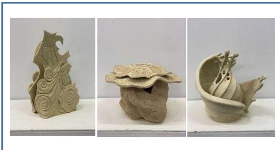
Gambar 7: Adaptasi Teknik dan Style

Peserta berjaya melaksanakan proses penghasilan pengaplikasian dan pengadaptasian karya 2D kepada 3D dengan cemerlang. Selain itu bakat dan style juga dapat dibangunkan sebagai rujukan dan simbolik lambang kepada identiti pengkarya itu sendiri. Hasil produk dan skop kajian yang diberikan berjaya memberi penekanan dan cabaran yang membuahkan hasil yang lumayan dalam membentuk dan melahirkan bakat serta pemikir bagi meneruskan warisan dan kepakaran serta warisan kraf ini agar tidak ditelan oleh arus pemodenan.