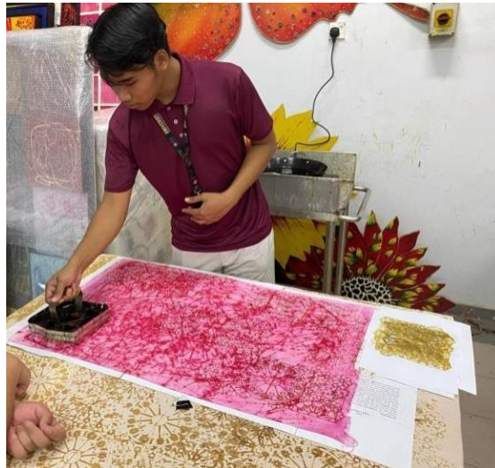
Gambar 3: Proses eksperimen teknik mengecap menggunakan blok batik oleh pelajar.