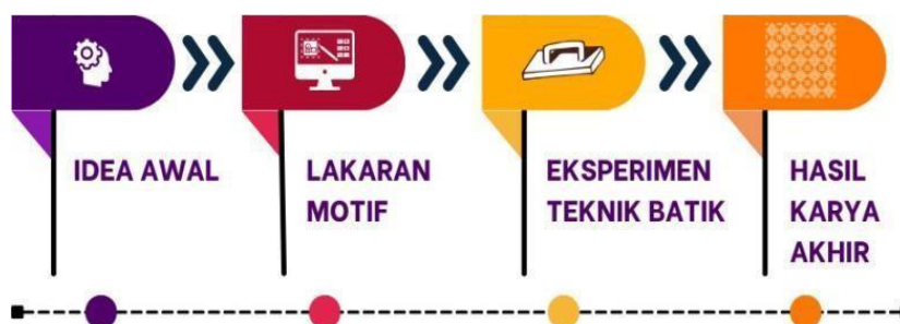
Rajah 1 : Aliran Proses Kajian