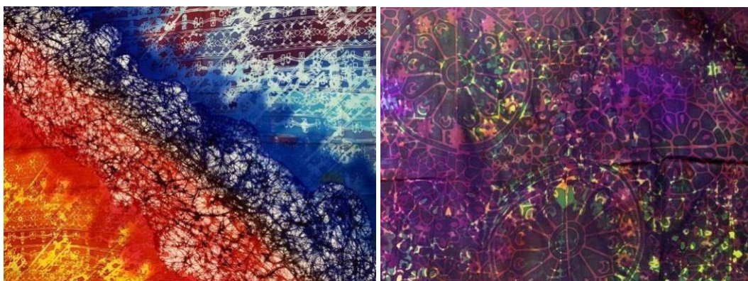
Gambar 6 : Hasil karya pelajar Studio Batik menggunakan teknik cap berlapis ( overlapping ) dengan pendekatan motif kontemporari berasaskan identiti UPSI

Seiring dengan itu, hasil karya pelajar yang dihasilkan sepanjang pelaksanaan kajian rintis turut memperlihatkan potensi kreativiti mereka dalam meneroka teknik dan motif baharu. Gambar 4 menunjukkan antara contoh karya pelajar Studio Batik yang memmanifestasikan keberanian untuk bereksperimen melalui teknik cap berlapis ( overlapping ), pengolahan warna, serta adaptasi motif yang diinspirasi daripada identiti institusi.