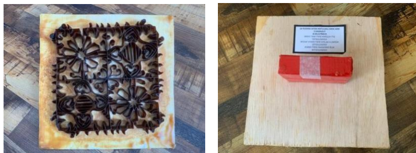
Gambar 4: Blok batik yang dihasilkan daripada bahan tidak sesuai menyukarkan proses pemantauan semasa mengecap

Dari segi masa, proses eksplorasi dan eksperimen reka corak memerlukan tempoh yang panjang, justeru menuntut mahasiswa agar lebih berdisiplin dalam pengurusan masa bagi menyiapkan karya dengan baik. Sementara itu, dari sudut kreativiti, cabaran utama ialah mencari keseimbangan antara mengekalkan nilai estetika batik tradisional dengan usaha menghasilkan rekaan motif yang lebih segar dan kontemporari. Menurut Lim dan Hassan (2023), keseimbangan antara tradisi dan inovasi merupakan aspek penting dalam pembangunan seni berasaskan warisan agar ia kekal relevan tanpa mengorbankan nilai asalnya.