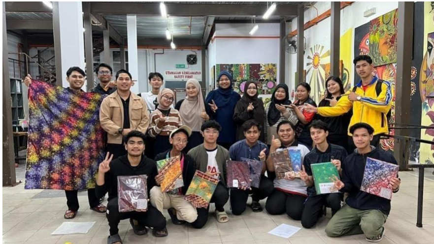
Gambar 5 : Pensyarah dan pelajar Studio Lanjutan Batik bergambar bersama sambil mempersembahkan hasil akhir Batik UG berinspirasi identiti UPSI selepas sesi penilaian.

Pensyarah memainkan peranan sebagai fasilitator sepanjang kajian ini. Selain bimbingan teknikal, pensyarah turut menekankan aspek teori seni, simbolisme dan kepentingan penghayatan terhadap identiti UPSI. Bimbingan ini memberi impak positif kepada keberanian mahasiswa untuk bereksperimen dan mengekspresikan idea secara lebih kreatif. Hubungan kolaboratif antara pensyarah dan pelajar membuktikan kepentingan sokongan akademik dalam meningkatkan tahap kreativiti mahasiswa di studio seni.