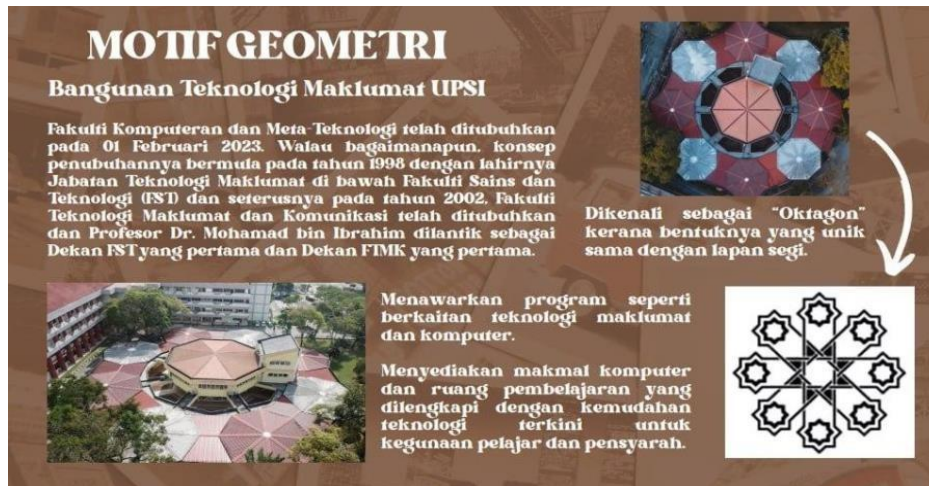
Gambar 1 : Lakaran awal motif berasaskan geometri oleh pelajar