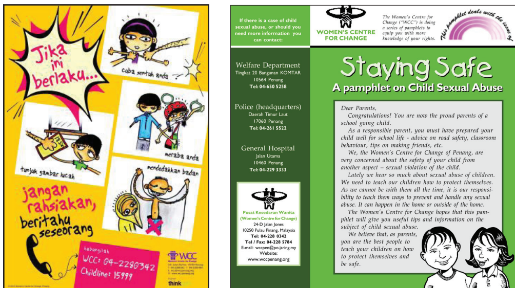
Rajah 3 Poster dan risalah yang digunakan untuk menyampaikan mesej kepada kanak-kanak dan remaja

visual dan multimedia dalam menyampaikan mesej kepada masyarakat di laman sesawang persatuan mereka dan mengagihkan risalah bergambar berkaitan penderaan kanak-kanak dari rumah ke rumah ( http://www.wccpenang.org/ diakses pada April 11, 2014). Ini secara tidak langsung menimbulkan kesedaran kepada umum dan kepada penyelidik tentang penggunaan visual dan media yang digunakan dalam membanteras isu penderaan kanak-kanak ini.