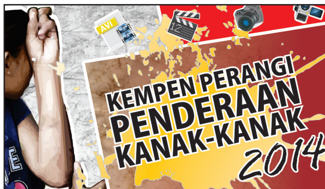
Rajah 5 Set siri poster 1 penderaan kanak-kanak yang dibangunkan

Analisis awal telah dijalankan mengenai penderaan kanak-kanak secara visual foto melalui satu perbincangan terbuka menggunakan saluran media sosial facebook secara kualitatif dan untuk mencapai objektif kajian. Seramai 40 pengguna media sosial facebook yang terlibat dalam memberi respon dan tafsiran maklumat yang dikehendaki. Lingkungan golongan ini terdiri daripada mereka yang berumur 20 hingga 35 tahun. Rata-rata mempunyai latar belakang pemegang diploma serta sarjana universiti tempatan di Malaysia. Mereka juga terdiri dari penganut agama dan berlatar belakang pekerjaan yang berbeza. Setelah perbincangan dilakukan dengan berpandukan kepada sebuah poster yang dibangunkan bagi melihat respon untuk mencapai objektif kajian, penyelidik mendapati seramai 34 orang pengguna amat bersetuju bahawa visual foto penderaan kanak-kanak harus diperbanyakkan lagi, manakala hanya 6 pengguna tidak bersetuju dan mencadangkan beberapa cadangan lain. Berikut merupakan hasil pandangan yang diberikan apabila ditanya adakah visual foto merupakan medium terbaik dalam menimbulkan kesedaran dan sebagai medium berkomunikasi dengan masyarakat, mereka berpendapat: