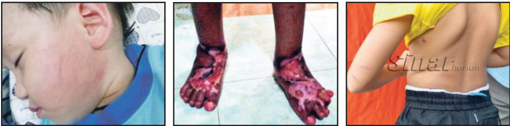
Rajah 6 Keratan akhbar penderaan kanak-kanak di Malaysia

Manakala instrumen ketiga yang digunakan adalah melalui keratan akhbar berkaitan kes penderaan kanak-kanak. Kesimpulan yang dapat dibuat melalui ketiga-tiga instrumen ini, penyelidik mendapati bahawa kurangnya penggunaan visual foto di dalam penyampaian mesej kepada orang ramai baik melalui media cetak mahupun media elektronik. Dengan analisis awal yang dijalankan penyelidik ingin terus mengupas dengan lebih mendalam tentang penyelidikan ini dengan menggunakan pendekatan seni visual foto untuk berkomunikasi dengan orang ramai tentang kes penderaan kanak-kanak di Malaysia.