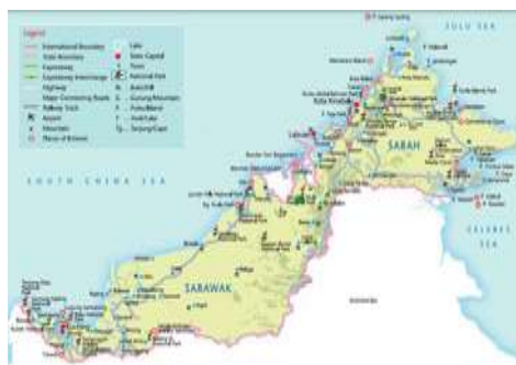
Rajah 1 Peta Kepulauan Borneo

Istilah Lun Bawang merujuk kepada Orang Ulu atau orang pedalaman yang menetap di kawasan kaki bukit dan berdekatan dengan sungai. Lun Bawang juga merujuk kepada sebuah masyarakat yang hidup dengan berhijrah dari satu tempat ke satu tempat di pulau Borneo bagi meneruskan hidup melalui sumber alam semulajadi yang di sekelilingnya. Namun begitu, masyarakat Lun bawang terdahulunya digelar sebagai kaum Murut. Menurut Tom Harrisson (1959) dan S. Runciman (1960), kaum ini adalah yang terawal menetap di kawasan pergunungan di pertengahan Pulau Borneo. Di Sarawak, kebanyakan masyarakat Lun Bawang menetap di bahagian kelima terutama di Lawas, Trusan dan di persisiran sungai Limbang. Lun Bawang juga terdapat di Kalimantan, Sabah dan Brunei. Di Sabah, mereka dikenali dengan panggilan Lun Dayeh.