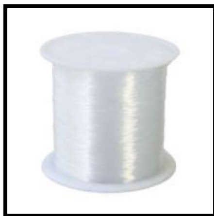
Rajah 11 Tali Jenis Cotton

Pengusaha manik di kawasan Lawas Sarawak biasanya menggunakan tali jenis cotton untuk menggantung manik. Tali jenis cotton ini tahan dan tebal berbanding tali jenis yang lain. Proses terakhir adalah manik disusuk dengan tali ini dan dibentuk mengikut jenis perhiasan manik kaum Lun Bawang. Setelah selesai disusuk bahagian hujung tali akan disimpul mati dan diselaput dengan lilin agar hujung tali ini tidak terbuka atau kusut.