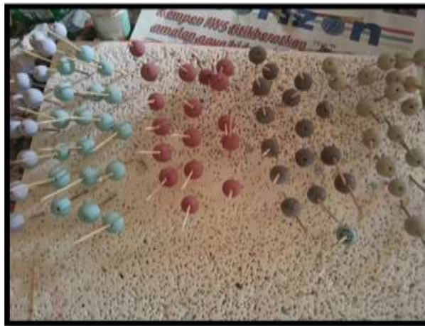
Rajah 10 Manik yang telah dilapisi dengan warna glaze

Manik yang telah dilapisi dengan warna glaze, akan disusun pada dawai stainless steel yang mampu bertahan pada paras suhu 1000 darjah Celsius sehingga 1500 darjah Celsius. Penelitian ini amat penting kerana proses pembakaran terakhir menggunakan suhu yang tinggi diantara 1100 darjah Celsius sehingga 1250 darjah Celsius. Untuk menahan manik dari terkena permukaan furnace, dawai stainless steel mampu menampung dan bertahan pada suhu tinggi tersebut. Proses pembakaran ini memerlukan masa selama 8 ke 9 jam dan suhu rehat 1 ke 7 jam sebelum dikeluarkan dari furnace.