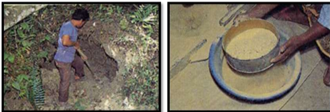
Rajah 8 Proses penapisan tanah sungai

Pengusaha manik menggunakan tanah sungai yang terdapat di kawasan tinggalnya. Tanah-tanah itu kemudiannya ditumbuk menggunakan lesung kaki. Selepas itu diayak dan ditapis untuk memisahkan sampah-sarap dan ketul-ketul batu yang ada. Setelah proses ayak, tanah itu diuli supaya ia menjadi padat. Proses ini memerlukan ketelitian bagi memastikan tanah itu menjadi padat dan bebas daripada gelembung udara. Tanah itu kemudiannya dibentuk menjadi silinder untuk memudahkan proses berikutnya.