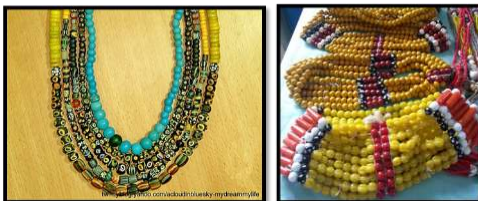
Rajah 3 Perhiasan manik kaum Lun Bawang

bakul dan keperluan harian lainnya. Manik merupakan harta pusaka kaum wanita yang dianggap sangat berharga bagi masyarakat Lun Bawang.