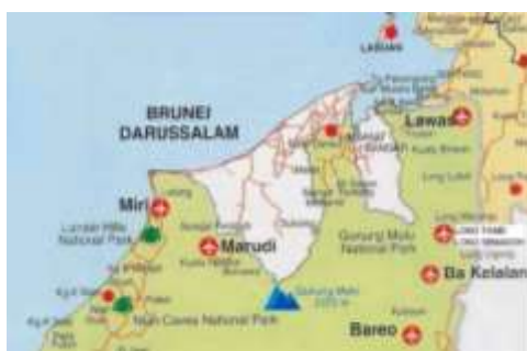
Rajah 2 Peta Bahagian Utara Sarawak Penempatan Majoriti Kaum Lun Bawang

Masa kini, sebahagian besar kaum ini masih tinggal di Kalimantan Indonesia; 25,000 di Kalimantan, Di Sarawak terdapat kira-kira 20,000 orang Lun Bawang di kawasan Daerah Lawas dan Limbang. Lawas ialah sebuah pekan kecil yang berlatar belakang banjaran Gunung Crocker. Ia mengambil masa 45 minit dari Miri, menggunakan pesawat kecil atau pengangkutan darat untuk sampai ke Lawas mesti terlebih dahulu melintasi Brunei. Kedudukannya terletak di antara Brunei dengan Sabah, di koridor timur laut Sarawak.