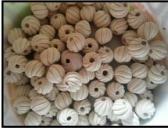
Rajah 9 Gentelan Manik yang siap ditebuk

Lun Bawang. Setelah selesai melorek, pengusaha menggunakan lidi untuk menebuk bahagian tengah gentelan manik yang masih separa kering bagi proses seterusnya.