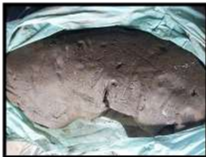
Rajah 7 Tanah Sungai Air Tawar

Masyarakat Lun Bawang suatu ketika dahulu menghasilkan manik secara tradisional iaitu melalui proses gentelan, pengeringan dan pembakaran. Pewarnaan atau glazing tidak ditekankan kerana kekurangan pengetahuan dan bahan. Pewarnaan manik mengikut warna alam iaitu warna tanah sungai yang diambil untuk proses penghasilan manik. Potensi warna manik ditentukan oleh warna semula jadi yang hakiki pada sumber alam dan bergantung pada jenis coloring matter yang ada pada tanah sungai tersebut.