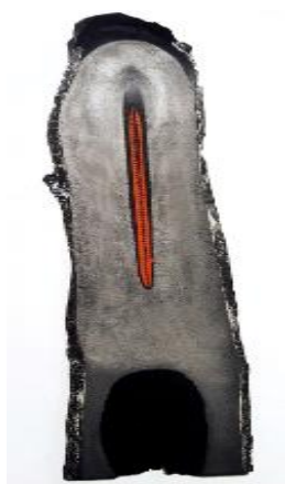
Gambar 9: Karya Juhari Said

Menerusi pemerhatian penyelidik, karya-karya yang dipamerkan telah memperlihatkan aplikasi media dan teknik seni cetak tidak semestinya dizahirkan dengan sifat fizikal sahaja tetapi boleh menjangkau minda seseorang. Misalnya karya Juhari Said bertajuk “ Haiku ” hasilan 2018, diolah dengan teknik cungkulan kayu secara tiga dimensi yang mengangkat matrik sebagai karya akhir tanpa pemindahan imej (gambar 9). Contoh lain adalah karya Sharul Jamili bertajuk “ Metalanguage XVI ” hasilan 2017 mengaplikasikan teknik gurisan asid dan konsep lipatan origami bahan aluminium menjadi karya tiga dimensi (gambar 10). Sama seperti Juhari, Sharul Jamili tidak melakukan pemindahan imej yang menjadikan matrik sebagai karya akhir beliau.