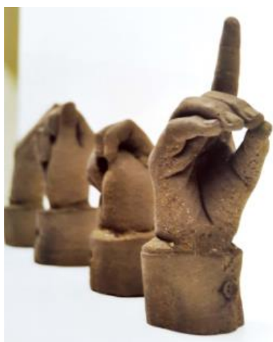
Gambar 3: Karya Shahrul Jamili

Karya-karya yang dihasilkan oleh artis-artis terpilih ini, cuba mentafsir konsep seni cetak dengan pengolahan ‘blok’ yang melangkaui batas sempadan seni cetak tradisi untuk berkeaktiviti secara bebas dengan medium cetakan. Pameran ini dilihat cuba menjelaskan pada masyarakat seni bahawa seni cetak boleh berevolusi, bersifat dinamik seperti bidang-bidang lain dalam seni halus dan tidak terikat kepada format gambar sahaja. Antara contoh adalah karya oleh Shahrul Jamili bertajuk “ Making Sense Can Sometimes Get Out of Hand ” hasilan 2008, yang menggunakan acuan untuk ‘mencetak’ bahan daripada simen (Gambar 3) dan Izan Tahir yang menghasilkan instalasi bertajuk “ Going ” hasilan 2008, menggunakan bahan kertas kasar dan potongan lino sebagai kaedah acuan (Gambar 4).