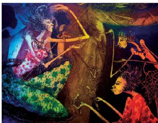
Loo Foh Sang | Sunset Series: Festival Dance | Etching & Aquatint | 2006 Gambar 2: Karya Loo Foh Sang

Gambar 1 dan 2. Karya Mohd Jamil Mat Isa bertajuk ‘ Pisang Emas di Bawa Belayar ’ 2006 dan Karya Loo Foh Sang bertajuk “ Sunset Series: Festival Dance ” 2006