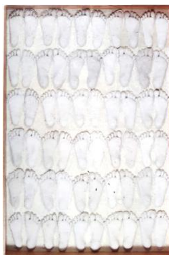
Gambar 4: Karya Izan Tahir

Gambar 3 dan 4. Karya Shahrul Jamili bertajuk ‘ Making Sense Can Sometimes Get Out of Hand ’ 2008 dan Karya Izan Tahir bertajuk ‘ Going ’ 2008