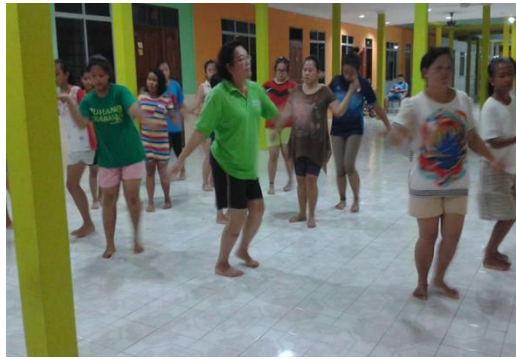
Foto 3: Sesi latihan tarian Ngajat yang di jalankan di rumah Panjang

Atas kesedaran dalam memelihara dan memulihara budaya Ngajat Iban tidak pupus ditelan zaman, sebuah badan pertubuhan bukan kerajaan iaitu Akademi Ranyai Gemilang telah ditubuhkan sebagai organisasi yang giat menjalankan aktiviti ngajat Iban dan mengekalkan gerak tari yang asli seperti yang digambarkan dalam foto 3. Usaha ini merupakan inisiatif pihak akademi dalam memastikan gerak tari yang asli dapat dibawa ke masa hadapan tanpa ada perubahan dalam gerak tari pada masa kini. Akademi tersebut turut mendapat sokongan penuh daripada Pihak Jabatan Kebudayaan dan Kesenian Negeri Sarawak (JKKNS) dengan memberikan penglibatan tenaga pengajar di Akademi Ranyai Gemilang menyertai bengkel dan seminar anjuran Jabatan Kebudayaan dan Kesenian Negara (JKKN) cawangan Sarawak pada tahun 2016. Usaha ini dilakukan untuk memastikan agar para pekerja yang bekerja di akademi ini dapat melakukan tugas dengan cekap dan inovatif selaras dengan objektif dan matlamat utama akademi. Selain itu, Promosi mengenai tarian ngajat Iban ini giat dijalankan untuk memberi kesedaran kepada masyarakat bahawa amalan tradisi perlu diteruskan kerana ianya merupakan amalan tradisi nenek moyang kita. Usaha pihak akademi mengadakan promosi merupakan satu usaha untuk memperkenalkan kepada masyarakat umum dalam melestarikan Ngajat Iban sebagai warisan tidak ketara masyarakat Iban di Sarawak.