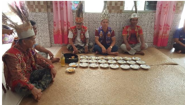
Gambar 2: Upacara Miring di Rantau Kembayau Manis Lubok Antu