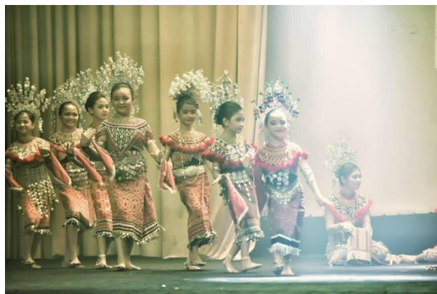
Gambar 1: Ngajat Indu

Terdapat beberapa jenis tarian ngajat untuk wanita Iban, antaranya ialah Ajat Niti Papan , Ajat Indu , Ajat Kumang Nurun Mandi , Ajat Ngelalu Temuai , Ajat Atas Capak . Signifikan Ngajat ini adalah sebagai tanda dan simbolik dalam mengalukan kedatangan tetamu ke rumah panjang atau sesuatu majlis. Kebiasaannya tarian ngajat ini akan dipersembahkan di depan rumah panjang atau di simpang jalan serta di dalam rumah untuk mengiringi tetamu yang masuk. Persembahan ini dipersembahkan sebagai tanda hormat penghuni rumah panjang terhadap tetamu yang datang. Bagi masyarakat Iban, menerima kunjungan tetamu ke rumah panjang adalah satu kehormatan dan harus diberi layanan yang sebaik mungkin. Mereka percaya bahawa semasa menerima kunjungan dari tetamu, semangat Petara