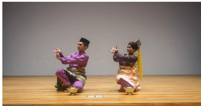
Rajah 7. Ragam gerak meliuk yang dicipta berdasarkan pada gerak melambai atau elang mengimbang dalam tari Inai Panggak Laut.