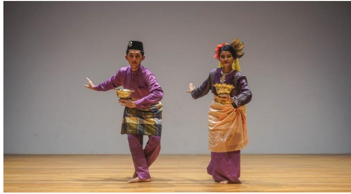
Rajah 15. Cawan yang digunakan untuk tari Seri Inai