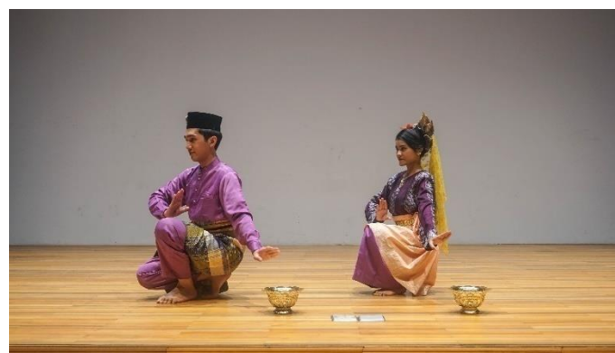
Rajah 12. Pola lantai “Y” menuju arah kanan depan yang dilakukan oleh masing-masing penari sehingga membentuk garis yang sejajar.