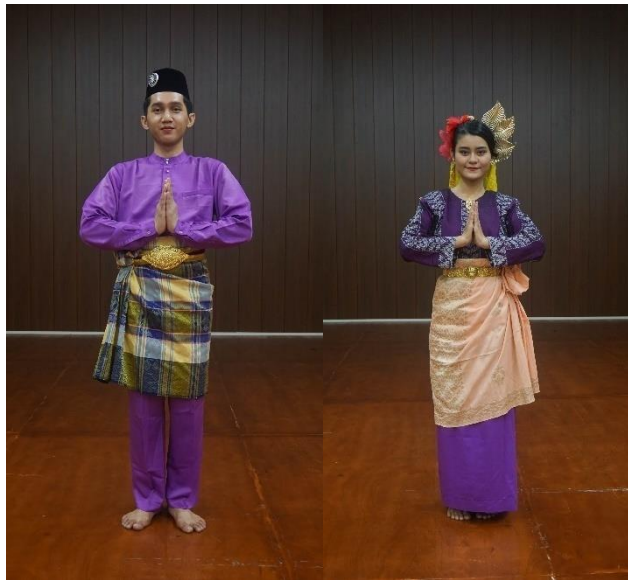
Rajah 14. Kostum tari Seri Inai daripada penari putra dan putri

Tata rias dan kostum tari Seri Inai diciptakan untuk menampilkan kewujudan penari lelaki dan perempuan dalam lingkaran nuansa pakaian orang Melayu. Kostum penari diambil daripada kebiasaan kostum dalam tari Inai Panggak Laut berdasarkan adab kesantunan masyarakat Melayu. Penari lelaki memakai baju Melayu cekak Musang, seluar baju Melayu dan kain songket dilengkapi dengan songkok. Manakala penari perempuan pula menggunakan baju kebaya labuh, kain dagang dan sarung songket dilengkapi dengan pending (aksesori dipinggang). Hiasan kepala penari perempuan menggunakan daun logam dan juga kain buatan sebagai pengganti dari tudung 'manto'. Tudung 'manto' adalah kain penutup kepala yang berasal dari Lingga hingga kini masih sering digunakan sesuai dengan acara yang diikuti. Tari Seri Inai adalah tarian kreasi yang mengambil acuan khas Lingga dengan penggunaan kain sebagai representasi imitative dari tudung 'manto' dalam ukuran jauh lebih kecil. Pertimbangan menggunakan kain ini mendorong secara dialektik pada aspek koreografi. Kain yang ukurannya lebih kecil dari bahan brokat serta mampu mengurangi beban penari dan tidak mengganggu gerak penari.