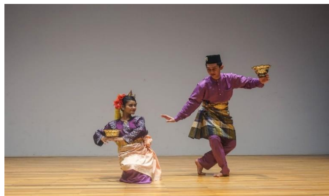
Rajah 8. Ragam gerak angkat cawan yang dicipta berdasarkan gerak tari membawa senjong atau cawan berlilin.