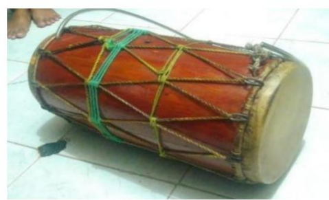
Rajah 13. Alat muzik iringan tari Inai Panggak Laut yang juga diterapkan sebagai alat muzik tari Seri Inai