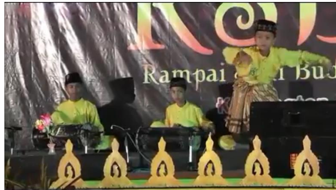
Rajah 1. Penari tarian Inai di Lingga pada acara Rampai Seni Budaya Melayu pada tahun 2012