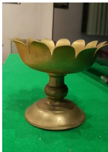
Rajah 16. Cawan senjong asli Lingga