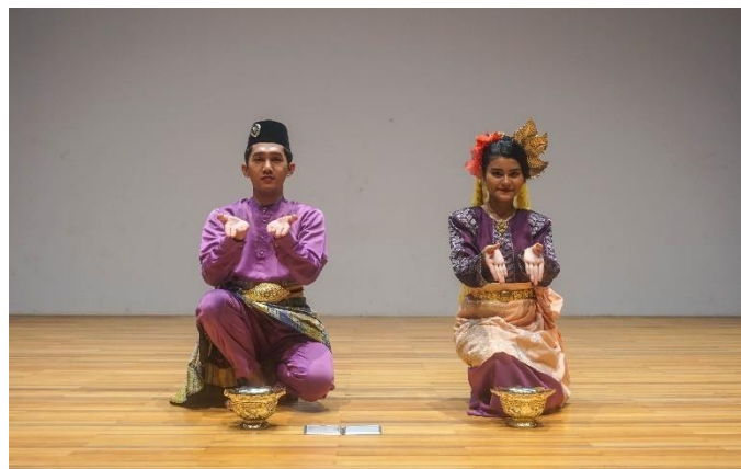
Rajah 10. Peragaan tari Seri Inai dalam komposisi tari duet berpasangan (putra dan putri)

Peragaan tari Seri Inai melibatkan penari lelaki dan perempuan. Komposisi penari duet disusun bagi memanfaatkan aspek koreografi yang tidak melanggar ketentuan tari Inai di Lingga secara umum. Hal ini kerana tarian Inai di Lingga ditarikan dengan peragaan tari yang tidak ditentukan dengan tegas. Justeru, memberi kesempatan untuk mengolahnya dalam komposisi penari Seri Inai sesuai keperluan pertunjukan dan pendidikan yang lebih teratur dan jelas. Landasan lain tentang komposisi penari duet ini adalah keadaan sewaktu individu yang mempunyai hajat perkahwinan mengkehendaki penari lelaki atau perempuan, atau penari lelaki dan perempuan boleh ditampilkan dalam satu waktu meskipun pada persembahannya mereka tampil secara bergantian. Oleh itu, komposisi penari duet ini menyesuaikan keadaan sekaligus menciptakan efisien terhadap pelaksanaan pentas susunan tarian ciptaan baharu Seri Inai dalam aspek waktu dan juga ruang pentas. Tari ini juga menetapkan bentuk komposisi duet penari perempuan dan lelaki dengan gerak tari yang seragam dan variasi ada pada daya gerak yang membezakan cerminan sikap tubuh antara seorang lelaki dan perempuan.