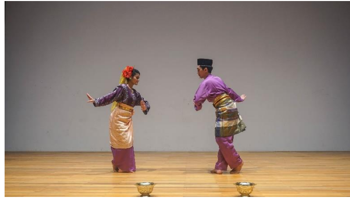
Rajah 13. Pola lantai “Y” menuju arah berhadapan yang dilakukan oleh masing-masing penari sehingga membentuk pola lantai yang berhadapan.