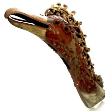
Ukiran kepala perahu dengan motif burung Gagak Sura. Digunakan untuk upacara Diraja. Makhluk mitos seperti Garuda 1, adalah kenderaan Tuhan mengikut fahaman sebelum Islam.