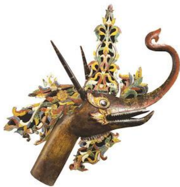
Makhluk mitos dikenali sebagai Vahana atau Varuna dalam epic Hindu. Dalam panggilan tradisi ia disebut Makara, iaitu makhluk akuatik yang dikenalpasti sebagai raksasa laut dari mitologi Hindu, berbentuk ikan berkepala gajah. Motif ini wujud sejak kedatangan agama Hindu sekitar 1800-1700 SM, sebagai simbol perlindungan bagi masyarakat nelayan.