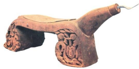
Kukuran kelapa. Hiasan relief motif flora melalui teknik ukiran separuh timbul.