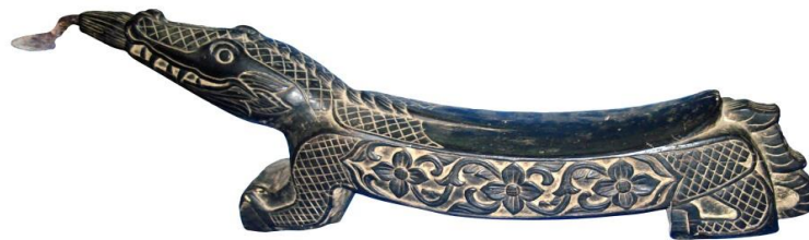
Kukuran kelapa. Hiasan relief motif flora pada bentuk seekor buaya melalui teknik ukiran separuh timbul.