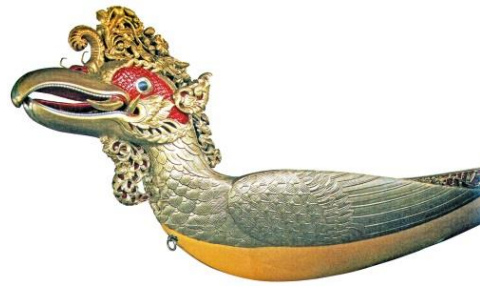
Burung Jentayu Petala Maha Indera Sakti terdapat di Istana Besar, Kota Bharu, Kelantan. Hiasan relief motif flora pada bentuk haiwan mitos melalui teknik ukiran separuh timbul.