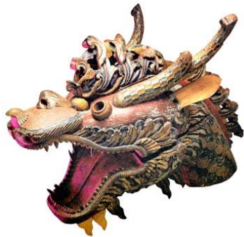
Ukiran kepala naga pada perahu Diraja Pahang. Hiasan relief motif tumbuhan pada bentuk haiwan mitos melalui teknik ukiran separa timbulan.