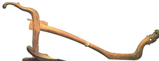
Tenggala. Konstruksi bentuk 3-dimensi yang dinamik dengan hiasan minima sulur bayung motif flora. Sumber imej: Syed Ahmad Jamal. Rupa dan Jiwa. DBP & KPM, 1922, p.43.