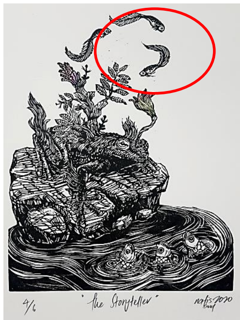
Rajah 4: Mohd Nafis Saad, The Storyteller, Linocut, 2020, 22.86 cm x 27.94 cm (sumber: https://aicadofficial.com/wp-content/uploads/2021/08/IVAE2020-e-catalogue.pdf )

katak dan manusia. Upacara meminta hujan dalam kepercayaan masyarakat melayu dahulu telah menjadi tradisi yang diwariskan secara turun temurun hingga kehari ini. katak pula digambarkan sebagai simbol perantara bagi komunikasi mistik yang dipercayai memiliki kebolehan memanggil hujan untuk tujuan kesuburan tanah pertanian. Haiwan ini nyata dianggap sebagai makhluk yang mampu menjayakan harapan besar oleh kelompok golongan yang terdesak mendapatkan sesuatu.