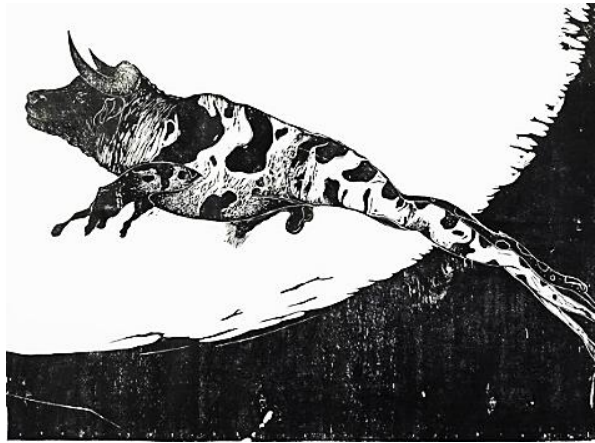
Rajah 2: Juhari Said, Katak Nak Jadi Lembu, Woodblock Print, 1999, 22.86 X 27.94 Cm (sumber: https://www.mutualart.com/Artwork/KATAK-NAK-JADI-LEMBU/276B1AF99064DCCA )

perlambangan simbol dan pemaknaan. Ianyanya dapat dilihat dalam konteks perspektif yang berbeza – beza berdasarkan pengalaman pengkarya dalam pembentukan dan penciptaan imej simbol berdasarkan refleksi dengan kehidupan peribadi, sosial masyarakat dan kebudayaannya.