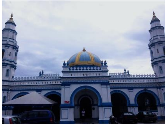
Figure 1. Masjid Panglima Kinta, Ipoh Perak.

Beberapa di negara Asia mempunyai segelintir penduduk Islam serta jumlah masjid yang sedikit. Namun, di dalam masjid tersebut terdapat motif Hindu-Buddha yang diukir lebih kepada haiwan, pengaruh Islam telah menyebabkan banyak motif ukiran bertukar kepada bentuk geometri, bunga, tunas, dan tumbuhan dedaunan. Islam telah mengubah kefahaman masyarakat Melayu dalam seni dan mula menerapkan unsur-unsur Islam dalam ukiran sebagai komponen hiasan (Pradisa et al, 2017). Kepercayaan Islam telah mempengaruhi perkembangan seni bina Islam di seluruh dunia. Walau bagaimanapun, terdapat pengaruh lain yang memberi kesan kepada pembangunan masjid, faktor tempatan seperti gaya hidup tempatan, pembangunan bandar, dasar tempatan, kepercayaan tempatan, dan budaya tempatan, dan faktor luaran seperti dasar luar, dasar komersial negara, dan dasar luar negara. Memandangkan tiada peraturan yang menyekat reka bentuk masjid, beberapa aspek budaya telah memberi inspirasi kepada beberapa arkitek dan tukang untuk membangunkan konsep masjid di bawah kepercayaan unik mereka terhadap kuasa Tuhan.