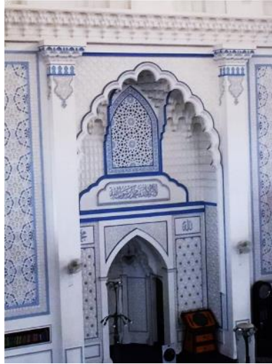
Figure 8 : Full motif at mihrab of mosque, Masjid India muslim Klang, Selangor.