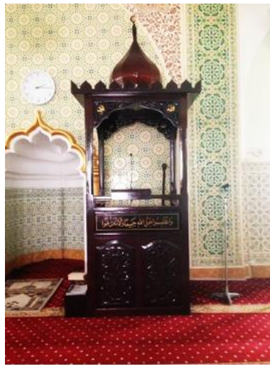
Figure 6: Mimbar of Masjid India Muslim, Ipoh Perak.