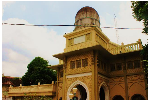
Figure 2: Masjid Ton Son Thailand.