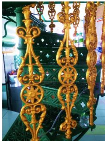
Figure 3: A motif found in Muslim mosques in India, the mosques used motif lotus motif on stairs.

Motif dalaman masjid tergolong dalam hiasan kerana ia adalah hasil ilham yang dibentuk oleh falsafah, lagenda, dan sejarah. Motif dijelmakan dalam bentuk simbol visual dan bukan visual dan lazimnya dipersembahkan dalam bentuk perhiasan dan warna yang relevan dengannya. Seperti motif bunga dan naga, geometri bukan sekadar bentuk, tetapi ia membawa simbol yang mewakili satu set elemen negatif dan positif tertentu yang merupakan asas Feng Shui. Adalah dipercayai bahawa motif geometri ini berfungsi untuk menangkis pengaruh jahat dan membawa kemakmuran dan keselamatan kepada bangunan atau benda-benda di mana ia dibuat. Begitu juga, swastika, yang juga dikenali sebagai "Salib Gammadion" atau "Hakenkreuz", adalah gambaran nasib atau nasib baik bagi sesiapa sahaja yang menggunakannya dan menjadi popular dalam mana-mana budaya dan masyarakat di seluruh dunia. Simbol ini, juga dianggap