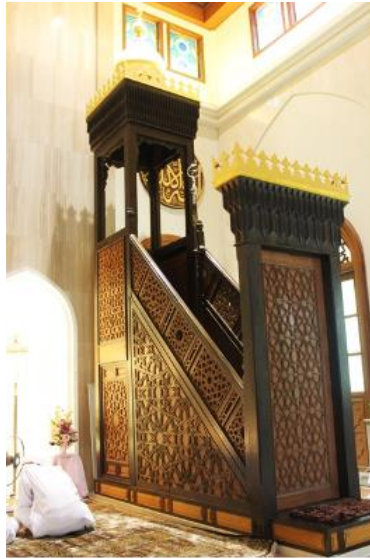
Figure 5: Mimbar of Masjid Tonson Thailand which used woodcarving geometry arabesque.