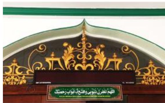
Figure 4: Arabesque used in the architecture of the mosque India Muslim, Masjid India Muslim, and Ipoh Perak.