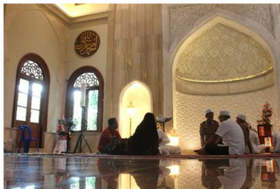
Figure 10: Interior of mihrab at mosque Tonson Thailand.

Mengenai Mihrab, yang diresapi oleh dinding kiblat, wujud di hampir semua masjid yang dibina di seluruh dunia, menjalankan fungsi penting untuk mengarahkan aktiviti sujud Muslim di masjid ke arah Ka'abah di Mekah sambil menyediakan ruang sendiri untuk Imam dalam Jemaah (Nazhar, 2016). Kajian ini menghuraikan peranan Mihrab melalui analisis reka bentuk dan hiasannya daripada 23 masjid bersejarah dan kontemporari terpilih di Malaysia. Pertama sekali, kajian ini melihat Mihrab sebagai satu 'focal point' yang perlu dititikberatkan dengan tahap keterlihatan yang tinggi dengan meneliti susun atur masjid khususnya di kawasan surau yang mana aktiviti sujud perlu dibantu oleh unsur-unsur liturgi masjid seperti sebagai Mihrab dan dinding kiblat. Keduanya, evolusi bentuk Mihrab dilihat daripada kajian tipologi yang memberikan gaya Mihrab yang digunakan di masjid-masjid Malaysia. Selain itu, Mihrab masjid Malaysia dan dinding kiblat bukan sahaja digayakan dengan pengaruh dari luar negara kerana terdapat gaya yang unik dan dikaitkan dengan orang Melayu. Ketiga, pemerhatian terhadap hiasan dinding Mihrab dan Kiblat telah mendedahkan bahawa masjid-masjid Malaysia mempunyai motif tumbuh-tumbuhan tersendiri yang menggambarkan identiti Malaysia dengan cara tersendiri. Tambahan pula, kajian mengenai Mihrab membuktikan bahawa nilai budaya dan sosial masyarakat Islam tempatan masih ketara walaupun Malaysia dan Thailand merasakan pengaruh daripada India, Arab, dan Cina (Hussin et.al, 2017).