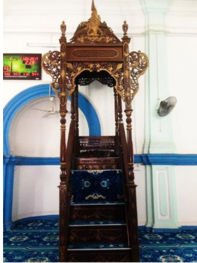
Figure 7: Mimbar of Masjid Panglima Kinta Ipoh Perak, which used of arabesque influence Malay and India.

Setiap masjid biasanya mempunyai mimbar iaitu tempat imam akan menyampaikan ucapan atau khutbah Saefullah (2018), Hiasan mimbar di masjid yang paling tradisional ini penuh dengan hiasan kaligrafi dan corak bunga memberi makna pemikiran Islam turut membawa mesej melaluinya. Selain itu, bunga lotus dipilih kerana bentuk dan warna bunga yang bertuah, serta kesuciannya. Tumbuhan pitcher digambarkan kerana bentuk dedaunannya yang menarik, dan ia boleh ditemui di persekitaran hidup luar bandar (Ernawati, 2020). Justeru, pengrajin Melayu memerhati keindahan persekitaran mereka dan melambangkan nilai tidak ketara menjadi produk fizikal yang boleh dihayati oleh orang lain. Pelbagai jenis hiasan mimbar yang biasanya penuh dengan hiasan dan hiasan terutamanya ukiran. Mimbar Masjid India Ipoh, Perak (mahkota mimbar dipengaruhi agama Hindu) serta mimbar Masjid Panglima Kinta, Perak. Masjid India Muslim, Klang dengan penuh corak bunga dengan simbol dan hiasan penuh corak bunga. Secara keseluruhannya, budaya Melayu diamalkan oleh masyarakat setempat dan dengan itu disesuaikan dengan setiap aspek seperti bahasa, agama, adat resam, seni bina dan lain-lain lagi. Motif seperti kosmos, haiwan, dan kerohanian boleh dilihat dalam ukiran Melayu tetapi pada zaman awal jenazah Hindu-Buddha hampir tidak dijumpai (Pradana, 2020).