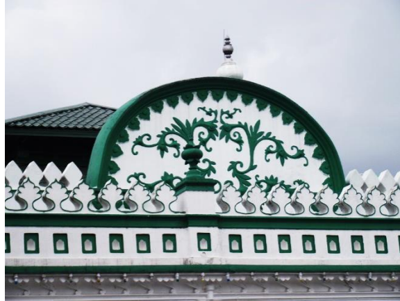
Figure 5: Decorative ornament on the exterior walls of the mosque, Ipoh Perak.

Budaya Melayu mula berkembang seiring dengan ajaran Islam sebagai pedoman hidup. Masjid menjadi lambang masyarakat Islam, serta nilai budaya yang telah diadaptasi mewakili kematangan dan kesediaan umat Melayu Islam untuk menzahirkan tradisi gaya hidup kepada masyarakat. Dalam usaha mewujudkan identiti perhiasan Malaysia. Mengenai elemen hiasan dalam seni bina negara, melihat kepada perkembangan masjid di Malaysia, kita dapat melihat perkembangan budaya Islam itu sendiri khususnya latar belakang sejarah dan garis masa yang berbeza. Seni adalah pancaran tamadun, pencapaian tamadun yang agung itu tergambar melalui kecemerlangan seni mereka, baik dari segi warisan fizikal mahupun dalam bentuk pemikiran. Skop kajian merujuk kepada sembilan elemen dalam sesebuah masjid tradisional iaitu mimbar dan mihrab di masjid Malaysia (Nafiah, 2021).