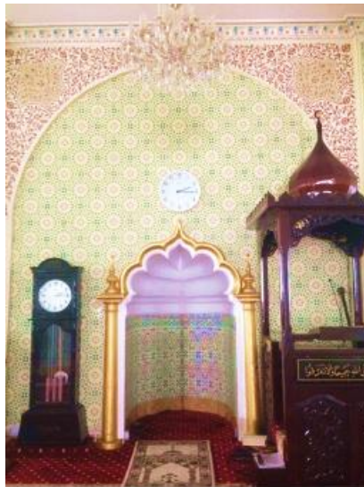
Figure 9 : One of the influences Moghul India mosque, Ipoh Perak.