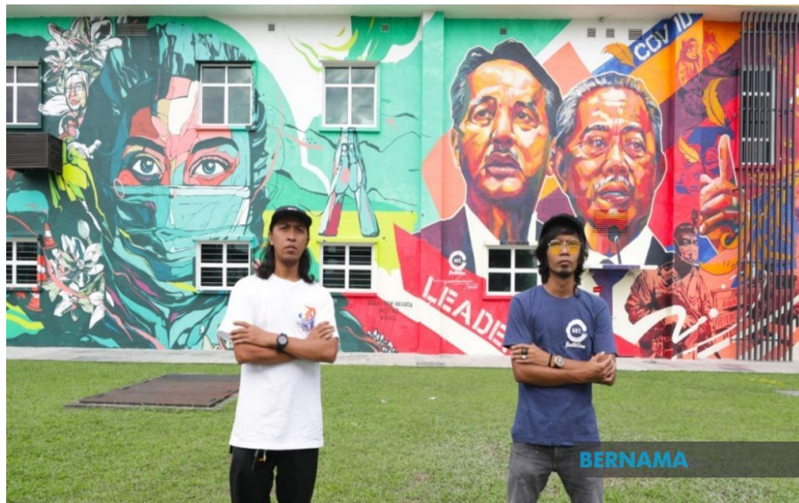
Rajah 3: Lukisan mural gergasi, dedikasi buat wira negara.