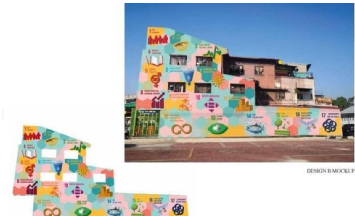
Rajah 4: Rekaan mural bertemakan “Inspirasi Matlamat Pembangunan Mampan”