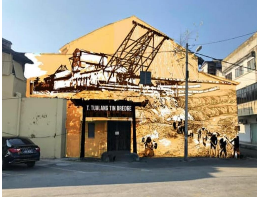
Rajah 5: Rekaan mural bertemakan “Sejarah Perindustrian Bijih Timah”

Sumber: Laporan Program Mural Geran Penyelidikan Antara Majlis Daerah Batu Gajah & Jabatan Seni Halus, KPSK UiTM Cawangan Perak (2021)