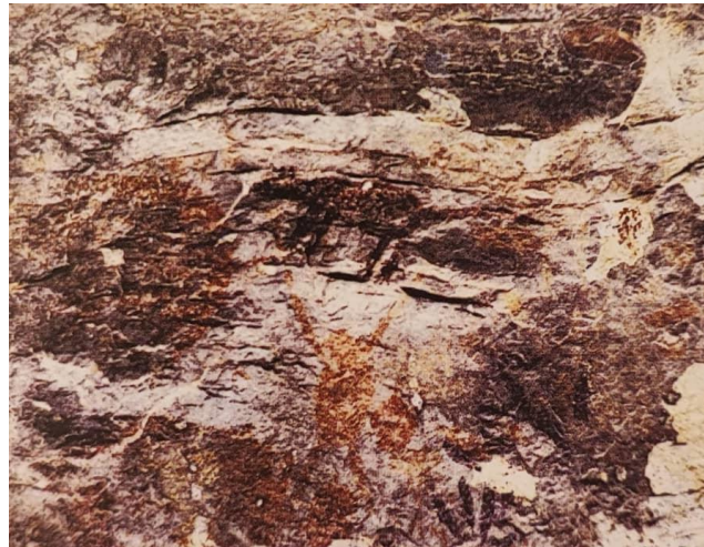
Rajah 2: Lukisan gua di Gua Tambun, Perak.