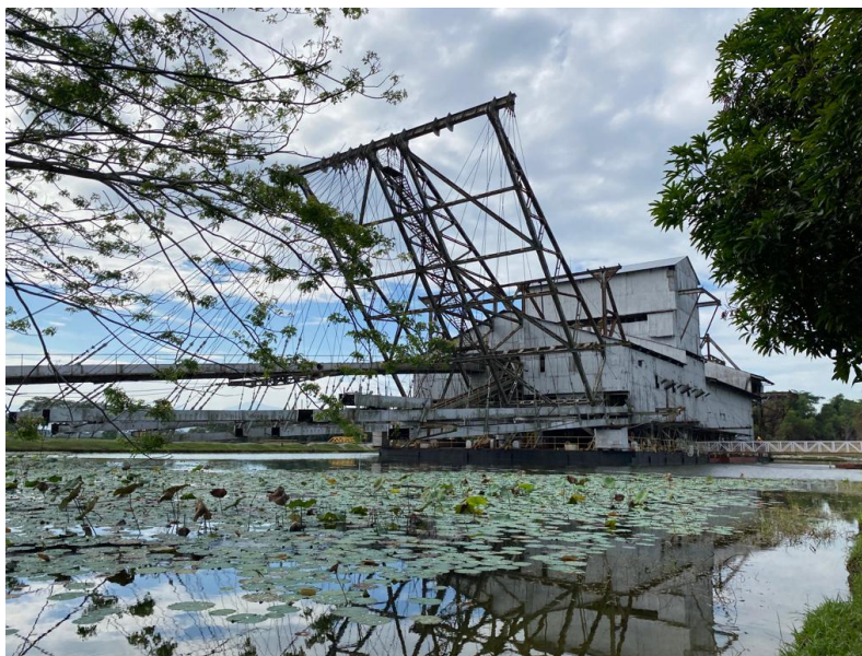
Rajah 6: Kapal Korek yang dikenali sebagai TT5 di Tanjung Tualang, Perak

‘TT5’ adalah gelaran atau nama bagi kapal korek terakhir yang masih lagi terdapat di Malaysia. Kapal korek yang tersergam indah ini terletak di Jalan Tanjung Tualang, tidak jauh dari bandar Batu Gajah. Gelaran ‘TT’ ini merujuk kepada tempat dimana kapal korek itu berada iaitu di Tanjung Tualang, manakala angka ‘5’ pula menandakan ia adalah kapal korek yang kelima berada disana. Melihat kepada size kapal korek ini, terbukti bahawa TT5 adalah antara jentera yang sangat penting dalam proses penggalian ketika itu, walaubagaimanapun, operasi penggalian ini terpaksa diberhentikan pada tahun 1982 berikutan kejatuhan harga komoditi bijih timah. TT5 ini menjadi warisan sejarah negeri Perak yang di gelar “ The Last Dredge ” dan kini dalam proses pemuliharaan semula. Jadi, tidak hairanlah pelukis menggunakan imej kapal korek di Tanjung Tualang ini sebagai subjek utama dalam rekaan lukisan mural bagi tujuan penyebaran informasi terhadap sejarah perindustrian bijih timah di Malaysia.