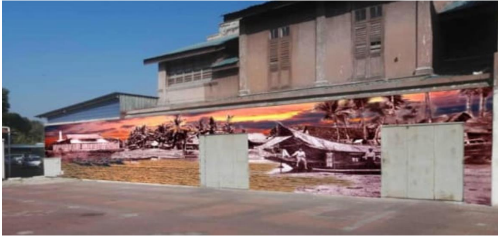
Rajah 6: Rekaan mural “Sejarah Penubuhan Batu Gajah”