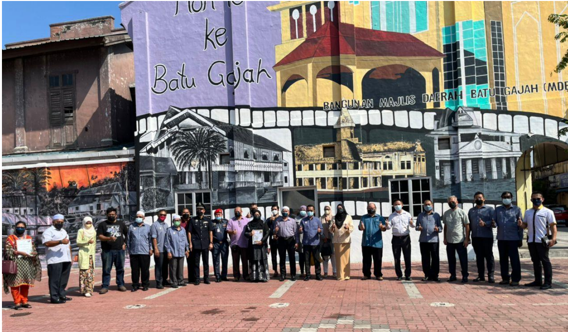
Rajah 8: Sekitar majlis perasmian mural Batu Gajah bersama wakil UiTM Cawangan Perak dan Majlis daerah Batu Gajah.