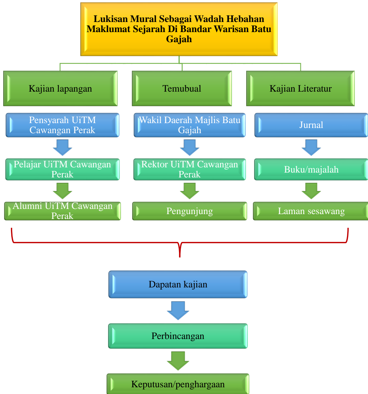
Rajah 1: Rekabentuk penyelidikan mengenai lukisan mural sebagai wadah hebahan maklumat sejarah di bandar warisan Batu Gajah