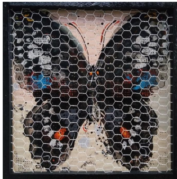
Rajah 2: Belum Bebas, Husin Othman, Akrilik, Galvanika di atas kanvas, 30.48 x 30.48 cm, 2021

Menurut Rohendi (2011) simbol dapat dipecahkan kepada tiga bahagian iaitu kata benda, kata kerja, dan kata sifat. Simbol yang diwakili oleh kata benda adalah seperti barang atau objek manakala kata kerja adalah sesuatu yang berfungsi sebagai menggambarkan, menggantikan dan memanipulasi. Simbol yang menjelaskan kepada kata sifat adalah berupa sesuatu yang lebih bermakna atau bernilai. Menurut Eizah Mat Hussain (2019) menjelaskan Simbol sebagai imej yang menimbulkan objek sebenar, konkrit dan daripada objek sebenar itu pula menyoroti kepada maksud atau pengertian yang lain. Dapat dijelaskan di sini, simbol boleh ditafsirkan berdasarkan kepada imej daripada objek yang dijelmakan dalam karya seni. Objek yang divisualkan itu, adalah berperanan sebagai bentuk untuk menggambarkan atau menggantikan sesuatu makna yang baharu. Pandangan terhadap makna juga dikongsi oleh Liza Marziana (2015) yang menjelaskan bahawa makna adalah kenyataan yang bersifat intelektual yang melibatkan ekspresi yang dicipta oleh pengkarya dan diterjemahkan oleh pemerhati. Oleh itu, makna adalah sesuatu yang bersifat intersubjektif atau boleh diertikan sebagai dihayati secara bersama, diterima dan dipersetujui oleh masyarakat. Menurut Kamus Dewan Edisi Keempat konteks menjelaskan tentang keseluruhan keadaan atau latar belakang yang mempunyai kaitan dengan penceritaan yang disampaikan. Dengan itu, konteks melibatkan keadaan, peristiwa dan situasi yang melibatkan pengalaman pengkarya seni.