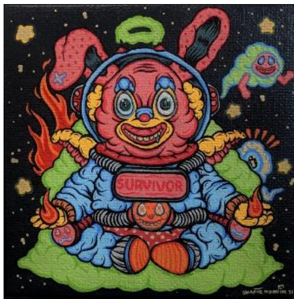
Rajah 3: Meditation , Shafiq Nordin, Akrilik di atas jut, 30 x 30 cm, 2021

Simbol adalah satu bentuk komunikasi antara pengkarya dan penghayat. Sapuan akrilik berwarna coklat lembut dan krim di atas dawai berjaring diletakkan pada permukaan kanvas di rajah 2 Aplikasi warna lembut pada latar belakang karya Husin Othman mewujudkan unsur ketenangan yang menggambarkan keperibadian beliau masih dalam keadaan terkawal sepanjang tempoh Covid-19. Husin Othman merasakan peristiwa Covid-19 yang berlaku telah memberi kesan kepada kehidupan sosial dan emosi masyarakat Malaysia semasa tempoh berkurung dilaksanakan. Penegasan yang ditunjukkan melalui objek jaring besi berupa pagar merupakan simbolik kepada penjarakkan sosial. Tindakan mengambil langkah mengurung diri dan menjaga penjarakkan sosial di kawasan sesak adalah sangat penting bagi memastikan kepentingan keselamatan bersama agar kita terlindung daripada ancaman bahaya.