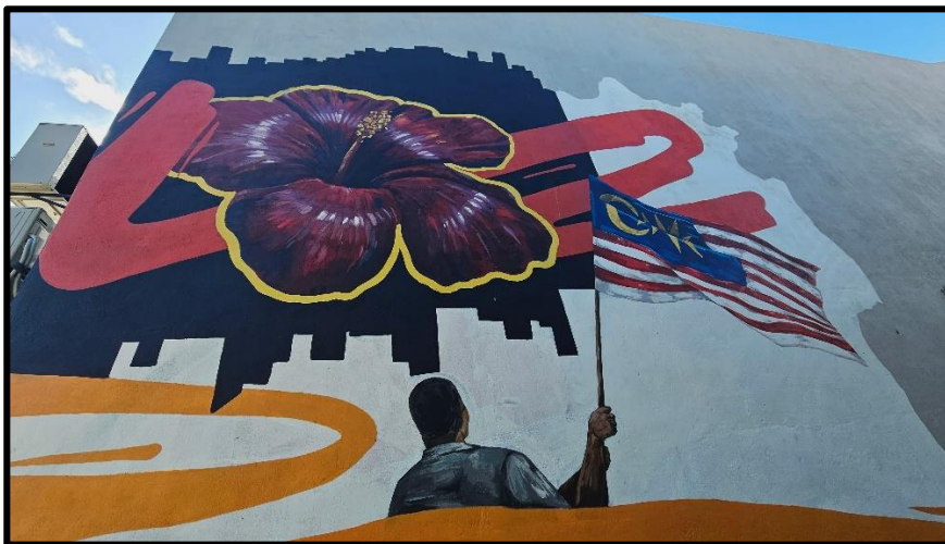
Rajah 2: Mural Bagan Datuk.

penghormatan yang merupakan identiti bagi sesebuah bangsa dan negara.