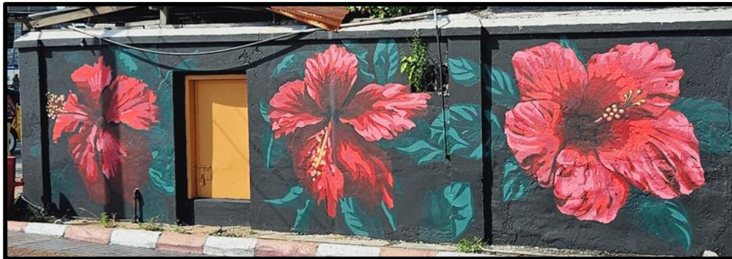
Rajah 3: Mural Bagan Datuk.

Dalam mural kedua, kelihatan subjek bunga raya beserta daunnya yang digambarkan secara horizontal (lihat Rajah 3). Subjek bunga raya divisualkan menggunakan prinsip kontras yang boleh dilihat pada pertembungan antara warna subjek dan latar belakangnya. Dapat dilihat bagaimana bunga raya yang berwarna merah kelihatan begitu menonjol dengan berlatarbelakangkan struktur berwarna gelap telah menarik perhatian penghayat untuk melihat mural ini. Dikaitkan dengan warna merah pada bunga raya itu sendiri adalah simbol kepada keberanian, keteguhan pentadbiran dan ekonomi serta keharmonian (Alias, 2022). Bunga raya atau nama saintifiknya adalah Hibiscus Rosa-Sinensis mempunyai lima kelopak yang mana melambangkan lima pecahan prinsip Rukun Negara.