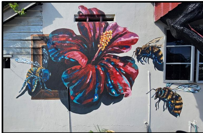
Rajah 4: Mural Bagan Datuk.