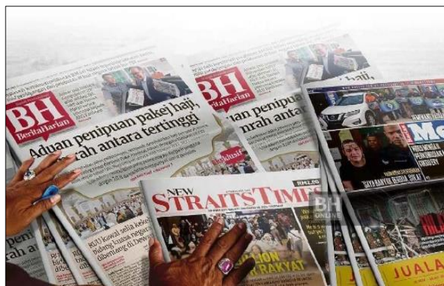
Rajah 2: Berita Harian, Surat khabar bercetak masih relevan, oleh Hamdan Abu, 4 Disember, 2023

Infografik kini digunakan secara meluas dalam media arus perdana untuk meningkatkan pemahaman pembaca tentang topik tertentu atau isu. Muhamad Firdaus, Abdul Aziz dan Nurazry (2019) menyatakan topik dimanipulasikan dengan sebaik positif mampu mewujudkan penerimaan umum yang berbeza. Di samping media tradisional seperti akhbar dan majalah ia juga akan menemui maklumat grafik dalam banyak digital saluran penerbitan dan semakin menjadi dihasilkan oleh pelbagai institusi sektor awam dan swasta sebagai sebahagian daripada strategi penerbitan. Infografik ditakrifkan sebagai visualisasi data atau idea yang cuba menyampaikan maklumat yang kompleks kepada penonton dengan cara yang boleh digunakan dengan cepat dan mudah difahami.