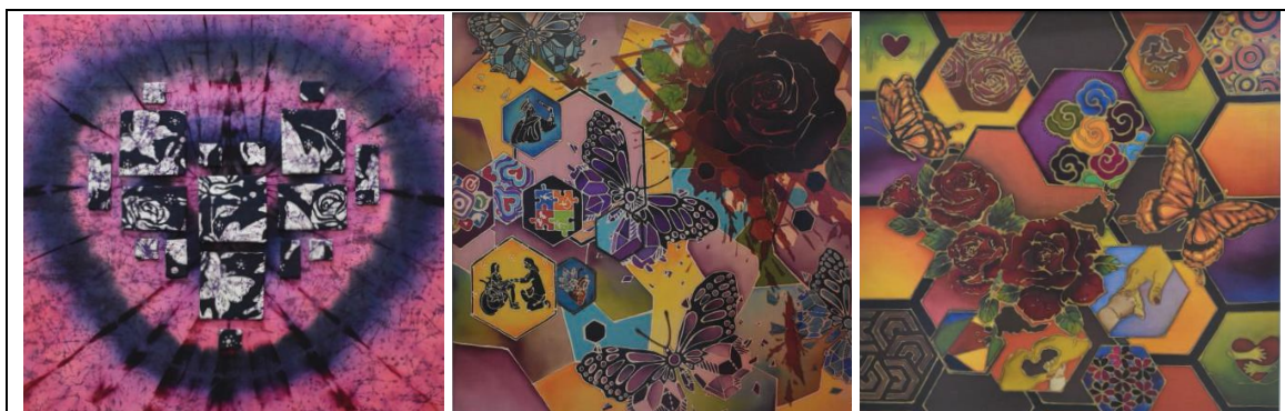
Rajah 6: Athirah Binti Ismail, Namun Ku Punya Hati, 2023, Batik, 2x2 kaki.

Dalam penciptaan karya-karya ini, para pengkarya mencurahkan usaha untuk merefleksikan isu-isu yang penting seperti kepelbagaian budaya, alam sekitar, dan masalah-masalah sosial yang relevan dalam masyarakat. Segelintir pengkarya menghasilkan karya dengan tujuan mencipta kesan emosional dan pemikiran dalam kalangan penonton, serta merangsang kesedaran terhadap isu-isu yang dibincangkan, ini dapat dilihat menerusi karya Athirah Binti Ismail dan Ummu Adilah Binti Mohd Pauzi.