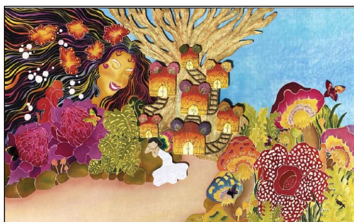
Rajah 5: Nurzuzaliena Binti Zulkifli, Imaginasi Fantasi, 2021, Batik, 5x3 kaki.

Menerusi karya Batik Imaginasi Fantasi oleh Nurzuzaliena Binti Zulkifli, fantasi dan imaginasi dalam dunia kanak-kanak menjadi sumber inspirasi beliau dalam penghasilan batik kontemporari. Batik, sebagai seni tradisional yang kaya dengan simbolisme dan warisan budaya, sering kali mengambil inspirasi dari alam sekitar, cerita rakyat, dan kepercayaan tempatan. Dengan mengaitkan fantasi dan imaginasi kanak-kanak dengan penghasilan batik kontemporari, seniman dapat mencipta rekaan-rekaan inovatif yang merangkumi unsur-unsur kreativiti dan imaginasi. Fantasi dan imaginasi kanak-kanak memberikan kebebasan kepada seniman untuk meluahkan kreativiti dalam proses penghasilan batik, menjadikan setiap karya batik sebagai satu kisah visual yang memikat.