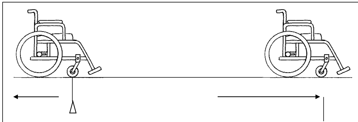
Rajah 1. Pengukuran Ujian One Stroke Push

(menggunakan kedua-dua belah tangan sekiranya subjek mampu). Selepas melakukan tolakan, subjek perlu menunggu sehingga kerusi roda berhenti dengan sendiri. Jarak (m) daripada permulaan garisan sehingga roda berhenti diambil dan bacaannya dicatatkan. Tiga kali percubaan diberi kepada subjek. Kedudukan tangan subjek pada roda adalah bebas semasa tolakan dilakukan untuk memastikan keselesaan subjek. Rajah dibawah menunjukkan cara yang dijalankan untuk mengambil bacaan dalam Ujian One Stroke Push Test .