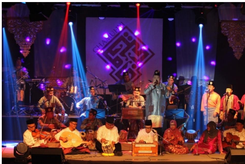
Rajah 9 Gabungan antara pemuzik veteran dan baharu GMJ dalam gubahan medley bertajuk 'Merindu-Melayu-Kesenangan'.