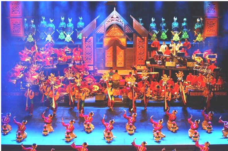
Rajah 6 Persembahan 'Simfoni Ghazal Johor' pada tahun 2012 di Istana Budaya, Kuala Lumpur, Malaysia. 5

GMJ juga pernah dicantumkan ke dalam album-album para penyanyi terkenal industri muzik tanah air. Noraniza Idris, penyanyi yang mendapat jolokan ratu Irama Malaysia pernah melakukan nyanyian semula dengan gubahan terhadap lagu-lagu 6 lama GMJ. Lagu-lagu tersebut diantaranya adalah 'Mustika Hati', 'Dendang Anak', 'Kuala Mersing' dan 'Puteri Ledang'. Cukup banyak lagu-lagu yang dinyanyikan semula oleh Noraniza Idris. Lagu-lagu itu dimuatkan dalam beberapa album, di antaranya ialah album 'Ala Dondang' (1997), 'Masyhur' (1998), 'Iktiraf' (2000), 'Aura' (2002), dan 'Sawo' Matang' (2004).