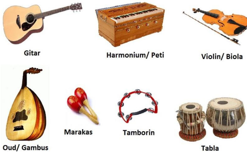
Rajah 4 Alat-alat muzik utama dalam GMJ. 4