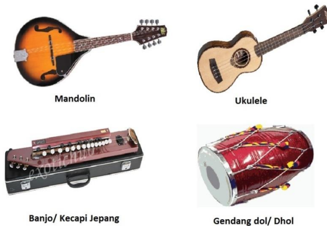
Rajah 3 Beberapa alat muzik yang pernah dicampurkan dalam GMJ dan kemudian tidak digunakan lagi. 3