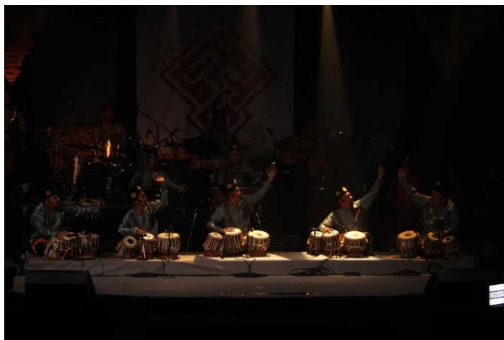
Rajah 8 Salah satu komposisi dalam karya GhaMuhyi bertajuk ‘Toda’ yang menonjolkan tabla GMJ