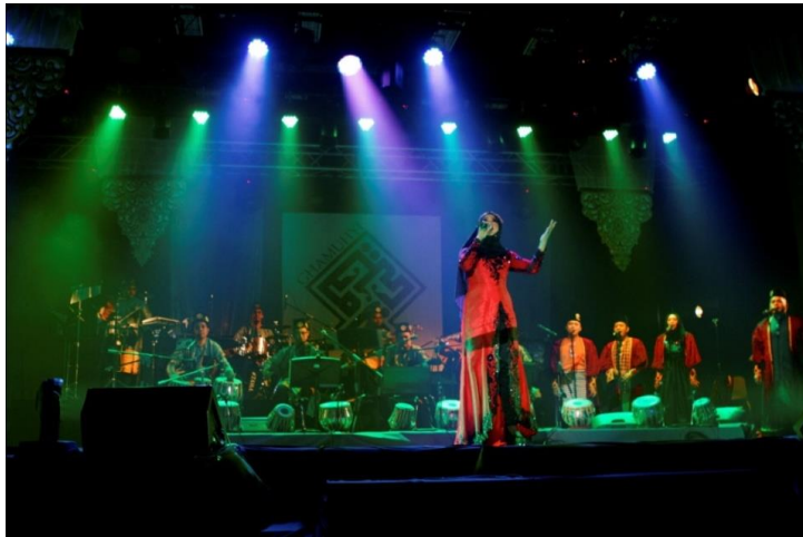
Rajah 7 Salah satu komposisi dalam persembahan karya GhaMuhyi yang bertajuk ‘Telunjuk Silir Sirat’

sudah mengalami kelompangan dari sudut kreativiti. Karya GhaMuhyi juga turut menyertakan aktivis-aktivis veteran GMJ di dalam persembahannya sebagai salah satu cara untuk memperlihatkan perkembangan komposisi yang dibuat sekali gus mengangkat potensi muzik tradisi di pentas masa kini. Berikut adalah beberapa gambar semasa persembahan GhaMuhyi berlangsung yang telah diadakan di Auditorium Muzium Negara, Kuala Lumpur pada 18 Disember 2015 (Rajah 7, 8, 9).