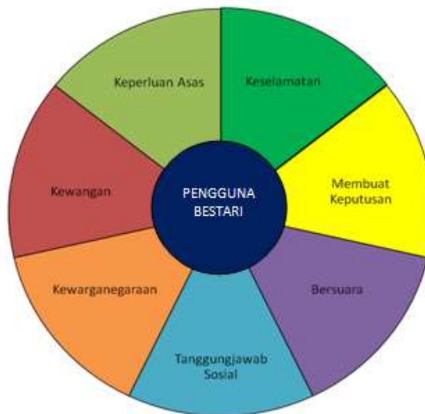
Rajah 2 Model Pengguna Bestari

Penyelidik turut menggubal dua buah modul bagi melaksanakan penerapan pendidikan pengguna praktikal dan berkesan di sekolah-sekolah rendah di Malaysia. Modul tersebut dinamakan Pengguna Bestari Tahap 1 dan Pengguna Bestari Tahap 2.