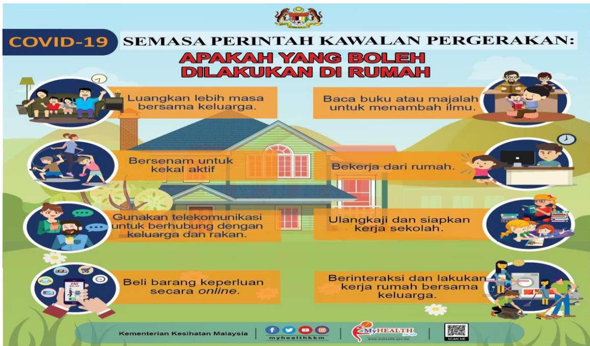
Jadual 3: Apakah Yang Boleh dilakukan di Rumah Semasa Perintah Kawalan Pergerakan