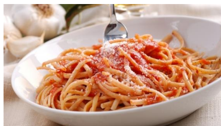
Rajah 2: Spagetti

Resipi spageti asalnya dari Itali, salah satu jenis pasta yang paling popular dan mempunyai pelbagai hidangan yang berbeza mengikut tempat ( Spaghetti recipes , t.t). Menurut Coy (2016), kebanyakan orang apabila ditanya tentang makanan Itali yang menjadi kegemaran mereka, akan terbayang satu pinggan besar dengan mi spageti yang dihiasi dengan sos daging yang hangat dan bebola yang bersup.