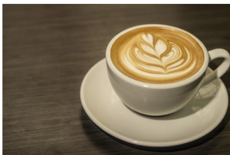
Rajah 2: Kopi "espresso".

Mengapakah "minum kopi dan makan spageti di Itali" pula? Kopi Espresso ialah sejenis kopi pekat ala Itali yang disediakan dengan cara melalukan air mendidih atau wap pada biji kopi yang telah dikisar dan dihidangkan tanpa gula dan susu. Kapucino pula sejenis minuman kopi yang juga berasal dari Itali, dicampurkan dengan susu dan dibuat berbuih dan biasanya ditaburi serbuk coklat (Siti Suhana Mohd Amir, t.t.). Menurut Siti Suhana Mohd Amir lagi, minuman kopi bukan sekadar dapat mengurangkan rasa mengantuk, malah memberikan ruang dan peluang dalam mempopularkannya dengan keperluan dan status gaya hidup masyarakat kini. Minum kopi dapat melawan kemurungan dan menjadikan hari anda lebih gembira atas faktor gaya hidup kini yang dibebani masalah kerja dan sebagainya. Menurut Bizzarri (2017), rakyat Itali masih mempertahankan reputasi negaranya sebagai "ibu kota kopi dunia". Reputasi Itali tersebut ada kaitan dengan sumbangan penciptanya, Milan Luigi Bezzera yang menghasilkan minuman kopi yang diberikan nama "espresso" pada tahun 1901.