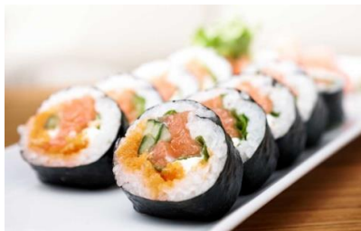
Rajah 3: Sushi (Diyana, 2017)

Perkataan “Jepun” dan “Itali pula merupakan nama tempat atau negara [ How Many Countries are there in the world? (t.t)]. Hawaii ialah sebahagian daripada negara Amerika Syarikat (Heckathorn, Motteler & Swenson, t.t).