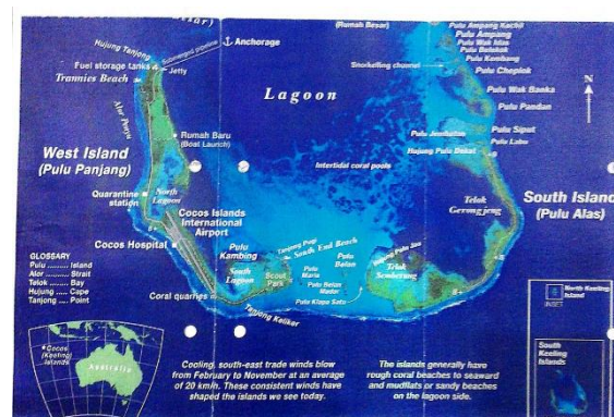
Rajah 1: Peta Menunjukkan Lokasi Pulau Cocos, Australia

Masyarakat Cocos di Sabah yang berhijrah ke Sabah mendiami beberapa tempat di daerah Tawau, Kunak, Lahad Datu dan Sandakan. Namun begitu, penempatan yang paling ramai adalah di Kampung Balung Cocos, Tawau. Biarpun kehidupan mereka sudah terasing dengan negara asal, tetapi amalan dan cara hidup mereka masih mengekalkan cara hidup nenek moyang mereka (Isa Romti et al. , 2018). Berdasarkan banci penduduk yang dilakukan oleh Jabatan Perangkaan Malaysia, negeri Sabah yang bermula 2010 dan akan berakhir 2020, ia tidak meletakkan secara spesifik jumlah sebenar masyarakat Cocos yang mendiami negeri Sabah kerana diletakkan dalam kumpulan Bumiputera lain-lain. Walau bagaimanapun, setiap tahun pihak Jabatan Perangkaan telah membuat unjuran mengikut etnik yang terdapat di negeri Sabah (Jabatan Perangkaan Negeri Sabah, 2019).