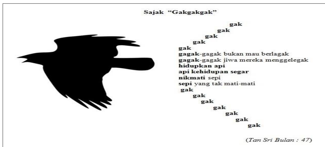
Rajah 3: Persamaan imejan burung gagak (kiri) dengan puisi “Gakgakgak”

Kepekaan serta pemahaman audien atau pembaca terhadap makna yang dikomunikasikan secara tersurat melalui sesebuah puisi akan membantu mereka memahami puisi tersebut secara holistik dan secara tidak langsung memperkasakan pemikiran audien atau pembaca untuk menterjemah penggunaan sesuatu bahasa yang diungkapkan di dalam puisi yang melatari sesebuah pendeklamasian. Menurut Ali (2022), karya kesusasteraan adalah sebuah karya yang indah dan praktikal dalam menjalankan fungsinya menyampaikan perutusan pengarang kepada pembaca