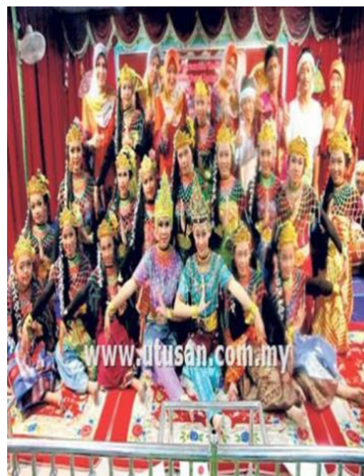
Foto 2 Kumpulan Putri Ratna Mas