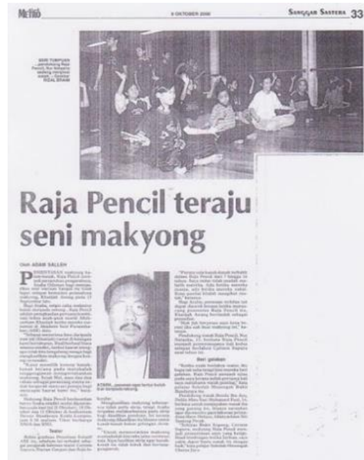
Foto 3 Keratan Akhbar Persembahan Mak Yong Raja Pencil