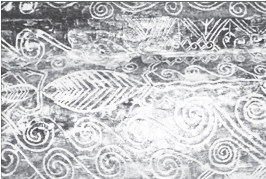
Gambar 4 Pola hias bermotif buaya yang distailistikkan yang terdapat pada keranda di Kompleks Batu Supu, Kinabatangan.