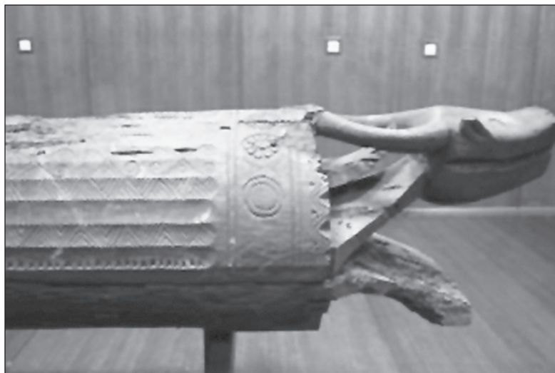
Gambar 2 Contoh keranda yang mempunyai pelbagai motif ukiran seperti Figura kepala seladang, lidah berlapis, berbelang, bertakik di bahagian hujung badan, pola hias mata gergaji, lingkaran pucuk paku dan bunga matahari.

bentuk ekor ikan, bentuk ular (Gambar 3), buaya (Gambar 4), kepala kijang (Gambar 5), anthropomorphik dan tumbuh-tumbuhan. 25 Walau bagaimanapun terdapat juga keranda kayu balak yang tidak mempunyai sebarang ukiran dan bentuk yang khusus. Ini disebabkan oleh sifat kayu yang terlalu keras dan sukar untuk diukir seperti kayu belian dan kerana kematian mengejut yang memerlukan penggunaan keranda dengan kadar yang cepat sedangkan ia belum disiapkan sepenuhnya.