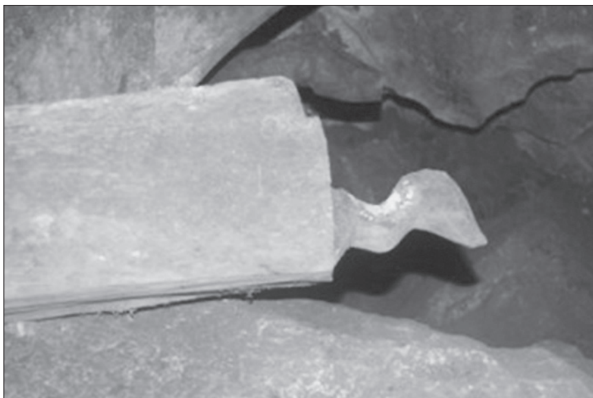
Gambar 5 Figura berbentuk kepala kijang dari tapak Gua Tapadong.