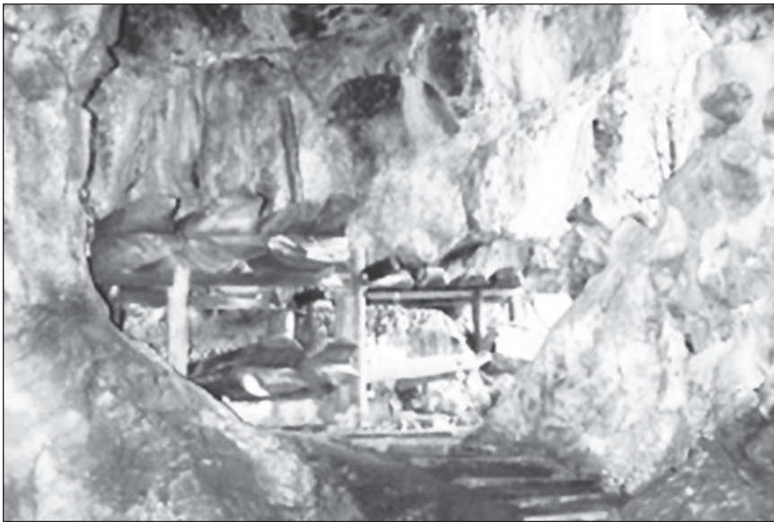
Gambar 6 Cara peletakan keranda berpangkin di Gua Batu Tulug, Kinabatangan.

di Agop Lintanga dan Agop Dimunduk di Gua Batu Tulug. Berdasarkan kepada penemuan satu tiang pangkin di Agop sawat, berkemungkinan bahawa di gua ini juga terdapat beberapa pangkin keranda tetapi ia telah rosak dan tidak dapat dikesan lagi pada hari ini. Kerosakan itu mungkin disebabkan oleh kadar lapisan tanah di gua ini yang agak nipis menyebabkan tiang keranda mudah rebah dan mungkin juga telah dialihkan oleh pencuri harta karun. Jadi kebanyakan keranda kayu balak hanya diletakkan di atas batu dan juga pelantar yang hanya menggunakan batu sebagai penyokongnya. Ini adalah cara yang kedua iaitu dengan meletakkan keranda yang telah sempurna sama ada di atas lantai tanah atau lantai batu dan terdapat juga yang diletakkan di lubang-lubang gua yang terdapat di dinding gua. Cara seperti ini digunakan di kesemua tapak penemuan keranda kayu balak kuno di Sabah.