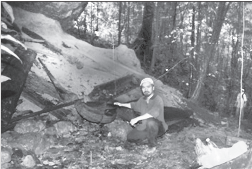
Gambar 1 Penyelidik bersama keranda kayu balak yang berukuran mencecah sehingga 20 kaki termasuk ukiran figura kepala seladang di bahagian hujung keranda di kompleks Gua Batu Supu, Kinabatangan.

yang disertakan sewaktu pengebumian dijalankan. Keranda kayu balak tersebut diperbuat daripada batang balak jenis dipterokap tanah rendah seperti kayu belian, meranti, merbau dan serayah. Ia dibuat dengan cara memotong batang balak mengikut kesesuaian dan secara purata antara 2.5 hingga 3 meter panjang bagi ukuran orang dewasa. Walau bagaimanapun terdapat keranda yang menjangkau sehingga 20 kaki termasuk bahagian hujung lidah keranda seperti yang ditemui di Batu Supu, Kinabatangan (Gambar 1). Ia kemudiannya dibelah dan ditebuk atau dikorek seperti dalam pembuatan perahu jalur ( dug-out canoe ). Cara ini mempunyai persamaan dengan teknik pembuatan keranda kayu balak yang terdapat kalangan masyarakat Sulod di Panay, Filipina sebagaimana yang pernah dinyatakan oleh F. Landa Jocano. 22