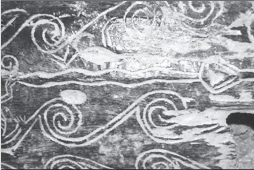
Gambar 3 Pola hias bermotif ular yang terdapat pada keranda di Kompleks Batu Supu, Kinabatangan.