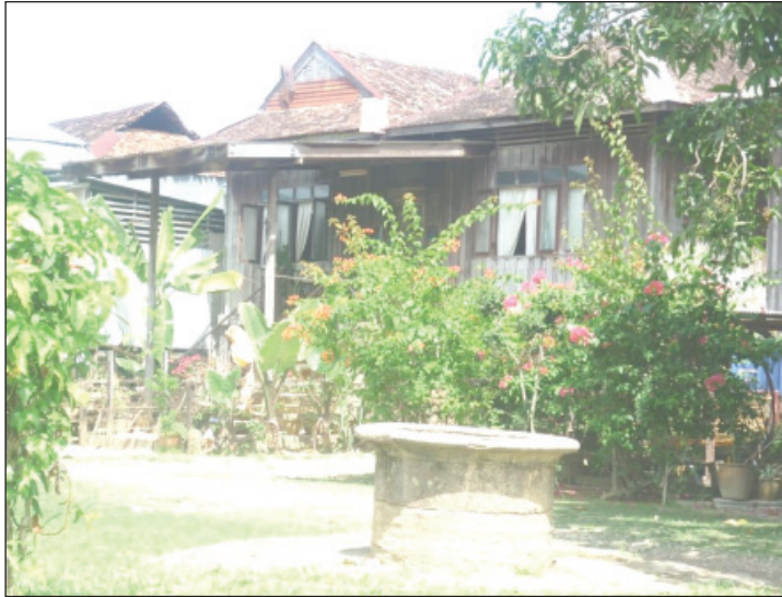
Foto 1 Perigi kebiasaannya telaga di tengah kelompok beberapa buah rumah.