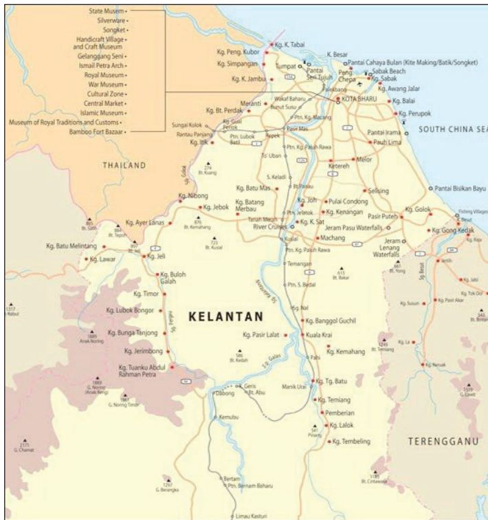
Rajah 2 Lokasi kajiselidik di kawasan Lembah Kelantan, bermula dari Kuala Besar, Pantai Cahaya Bulan sehingga Kampung Perupok, Bachok

Dapat dirumuskan bahawa kawasan kajian bagi penyelidikan ini adalah kawasan yang memiliki geografi yang hampir dengan muara sungai. Kawasan yang terlibat ialah kampung-kampung dalam jajahan Kota Bharu. Kawasan yang hampir dengan muara sungai ini juga dikenali sebagai Lembah Kelantan. Kawasan ini merupakan dataran subur yang disempadani oleh jajahan Tumpat di utara, Tanah Merah di barat dan Pasir Putih di tenggara. Kawasan dan kampung yang terlibat ialah di Kuala Besar, Pantai Cahaya Bulan, Pantai Senok, Pantai Dasar Sabak dan Kemasin di Bachok (Rajah 2).