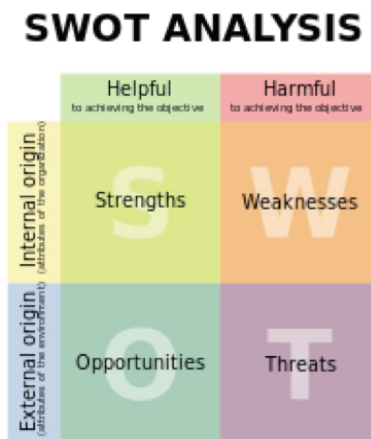
Rajah 1 Analisis SWOT

Analisis ini dipilih dalam drama kerana ciri-cirinya bertepatan dengan lakonan iaitu kekuatan, kelemahan, peluang dan ancaman.