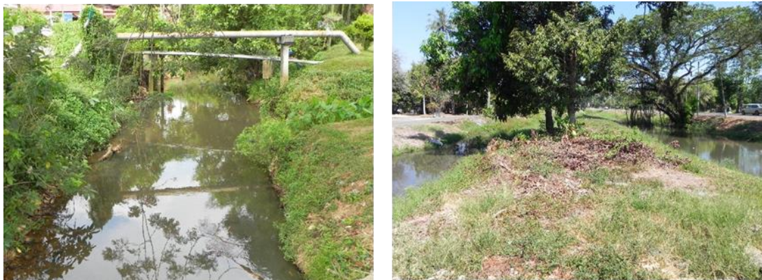
Rajah 2. Terusan Wan Muhammad Saman yang masih dalam keadaan parit tanah (kiri) dan pulau buatan yang terdapat di Daerah Yan (kanan).

Sebahagian besar bentuk fizikal terusan masih dalam keadaan parit tanah di sepanjang Laluan Persekutuan 1 (Alor Setar - Gurun). Keadaan terusan ini berubah kepada parit konkrit di beberapa lokasi seperti di Tandop sehingga ke Tanjung Chali (Daerah Alor Setar) dan di Guar Cempedak (Daerah Yan)(Rajah 1). Keunikan terusan ini adalah mempunyai dua buah pulau buatan yang terletak di Daerah Yan dipercayai wujud semasa pembinaan terusan ini. Terusan Wan Muhammad Saman juga telah terputus di dua kawasan kesan pembinaan Terusan Tengah dan Terusan Selatan oleh pihak MADA bagi tujuan pengairan air ke sawah padi di sekitar Daerah Yan dan Daerah Kota Setar (Rajah 2).