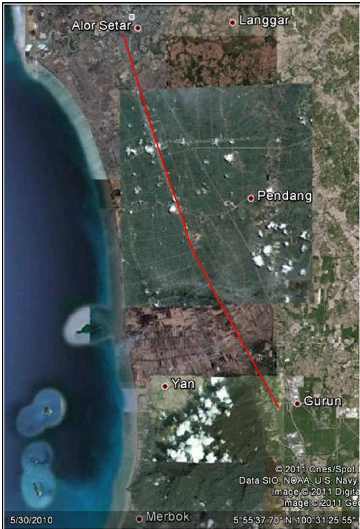
Rajah 1. Lokasi Terusan Wan Muhammad Saman.