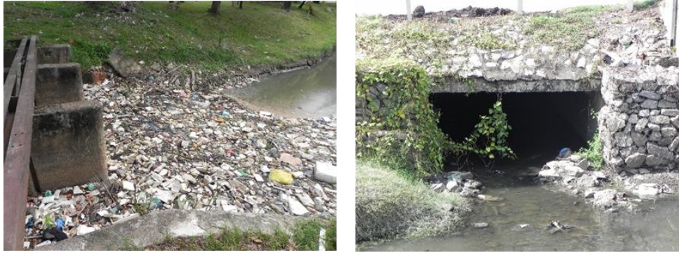
Rajah 3. Timbunan sampah sarap hasil daripada aktiviti perbandaran dibuang ke dalam terusan (kiri) dan pemetung yang dibina tidak mengikut spesifikasi menyekat aliran air (kanan).