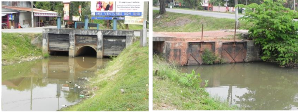
Rajah 8. Struktur kunci air yang masih berfungsi terletak di simpang jalan ke Sedaka - Yan di kilometer 28 Lalan Persekutuan 1 (Sungai Petani - Alor Setar) (kiri) dan struktur kunci air yang telah rosak akibat pembinaan titi ke rumah penduduk yang terletak di Kampung Batu 17, kilometer 29 Lalan Persekutuan 1 (Sungai Petani - Alor Setar) (kanan).