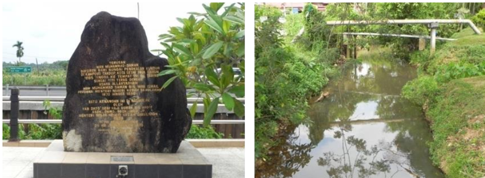
Rajah 9. Batu peringatan yang mengisahkan pembinaan terusan (kiri) dan keadaan air terusan yang bersih dan tidak tercemar (kanan).

Lokasi ini terletak di kaki Gunung Jerai dan merupakan pintu masuk utama ke pusat peranginan di puncak gunung. Sebuah batu peringatan dibina oleh kerajaan negeri kerana tiadanya sebarang tanda di kaki Gunung Jerai (Rajah 9). Batu peringatan ini dibina atas syor pihak muzium. Lokasi ini mudah dilihat oleh orang ramai dan dibina satu dataran kecil yang dilengkapi kemudahan surau, tempat letak kereta, gerai dan pusat informasi pelancong ke Gunung Jerai.