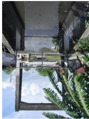
Rajah 6. Kunci air lama.