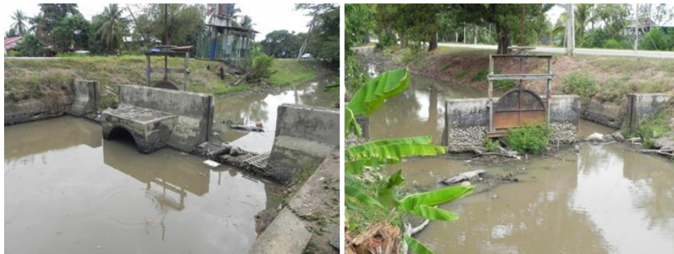
Rajah 7. Struktur kunci air yang telah rosak (kiri) dan keadaan terusan yang ditumbuhi tumbuhan air dan pokok-pokok di tebingnya (kanan).

Sebuah kunci air lama terdapat di sini dan didapati bahawa ianya tidak lagi berfungsi (Rajah 7). Lokasinya terletak di Kilometer 25 Laluan Persekutuan 1 (Sungai Petani - Alor Setar) berhampiran dengan persimpangan ke Sungai Limau Dalam. Keadaannya terbiar dan ditumbuhi pokok-pokok dan orang ramai tidak mengetahui lokasi ini. Struktur kunci air masih kekal seperti sedia ada.