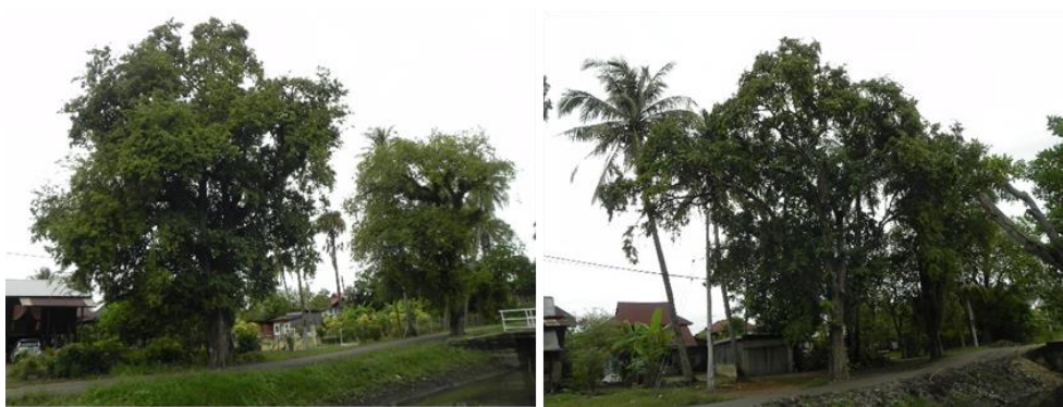
Rajah 5. Peninggalan pokok-pokok asam yang berusia ratusan tahun di tanam setelah Terusan Wan Muhammad Saman siap dibina di tebing sebelah kiri sepanjang terusan di sekitar Pekan Simpang Empat, Alor Setar.

Sepanjang penelitian di tapak, penulis mendapati bahawa pokok-pokok asam ini banyak terdapat di sepanjang terusan di Kilometer 12 hingga Kilometer 7 (Laluan Persekutuan 1 Sungai Petani - Alor Setar) berhampiran Masjid Taqwa Selarong Batang sehingga ke Pekan Simpang Empat (Rajah 5). Pokok-pokok ini berusia dalam lingkungan ratusan tahun dan masih lagi subur dan mengeluarkan buah sehingga kini.