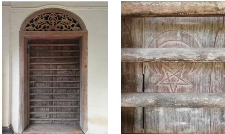
Rajah 2: Pintu utama Rumah Besar