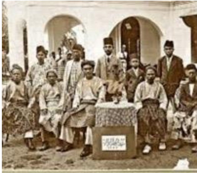
Rajah 4 : Masyarakat Mandailing dan juga masyarakat setempat berkumpul di Rumah Besar Raja Bilah.