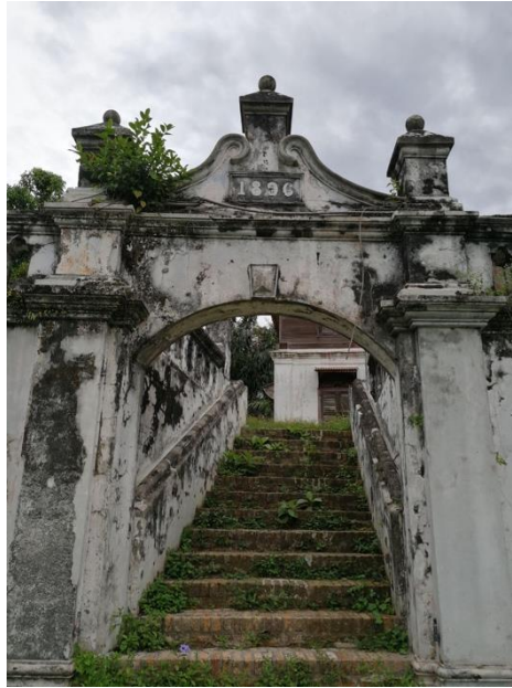
Rajah 3 : Pintu Gerbang kompleks Rumah Besar Raja Bilah

Dengan pembinaan Rumah Besar tersebut, Raja Bilah sebagai penghulu di Papan telah menggunakan kompleks rumah adat dalam melaksanakan tugas dan tanggungjawab beliau sebagai penghulu dan juga sebagai ketua adat bagi masyarakat Mandailing di Perak (Abdur-Razaq & Khoo Salma, 2003). Semua aktiviti adat dan budaya Mandailing dilaksanakan di Rumah Besar ini. Secara tidak langsung, Rumah Besar ini telah menjadi tempat tumpuan masyarakat Mandailing di Perak untuk berkumpul dan mengeratkan silaturrahim sambil meneruskan dan mengamalkan adat dan budaya mereka. Kewujudan kompleks Rumah Besar sebagai Kota Papan juga turut memudahkan urusan pentadbiran Raja Bilah sebagai Penghulu di kawasan tersebut.