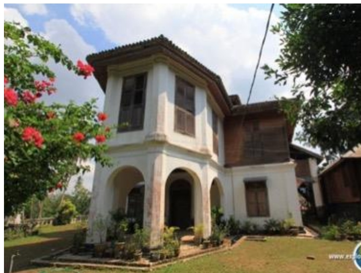
Rajah 5: Bentuk Rumah Besar Raja Bilah dari hadapan