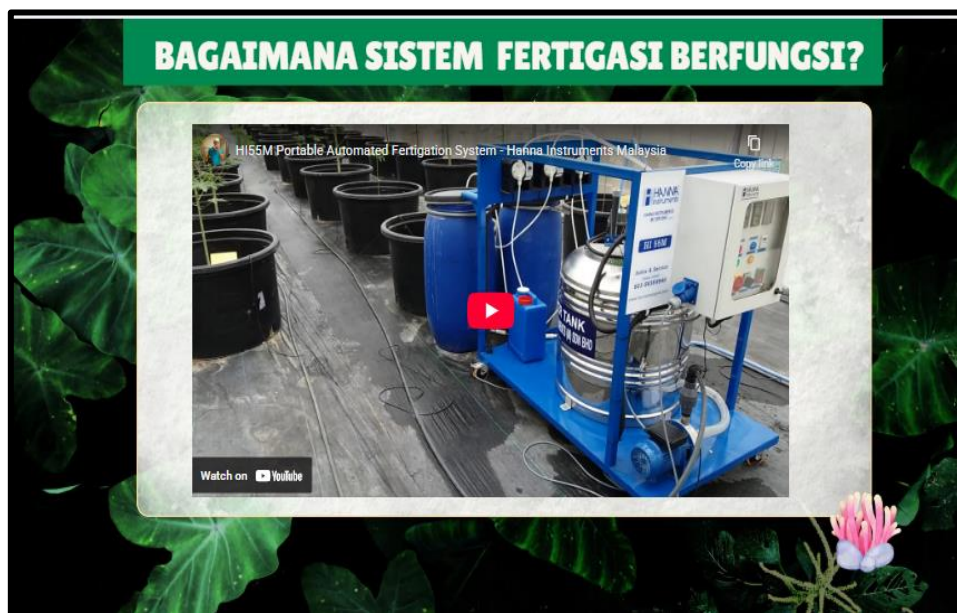
Rajah 3. Video yang diletakkan dalam E-Modul

Berdasarkan Rajah 2, modul dibangunkan dengan penggunaan bahasa yang ringkas, susun atur yang kemas dan navigasi yang mesra pengguna bagi memastikan penyampaian maklumat lebih jelas dan mudah difahami. Pendekatan ini selari dengan kajian Andre et al. (2024) yang menegaskan bahawa penggunaan elemen visual dan multimedia membantu menjadikan pembelajaran teknikal lebih menarik dan kontekstual. Selain itu, pengkaji turut memasukkan elemen multimedia seperti video pembelajaran dan gambar komponen fertigasi bagi membantu murid memahami aplikasi sebenar sistem fertigasi. Rajah 3 menunjukkan contoh video yang dimasukkan dalam modul, manakala Rajah 4 menunjukkan gambar komponen fertigasi yang digunakan dalam E-Modul Easy Learning Fertigation .