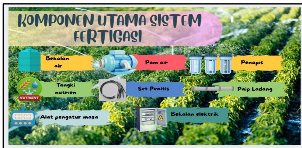
Rajah 4. gambar komponen dalam E-Modul

Penggunaan gambar realistik komponen, susunan paip dan aplikasi sebenar sistem fertigasi membantu murid mengaitkan teori dengan situasi praktikal. Pendekatan ini selari dengan kajian Rosli dan Rus (2022) yang menyatakan bahawa penggunaan bahan visual dalam pembelajaran fertigasi membantu meningkatkan kefahaman pengguna terhadap sistem dan komponen fertigasi. Selain itu, modul turut mengandungi galeri maklumat tambahan berkaitan sistem fertigasi bagi memperkukuh pembelajaran murid seperti yang ditunjukkan dalam Rajah 5.