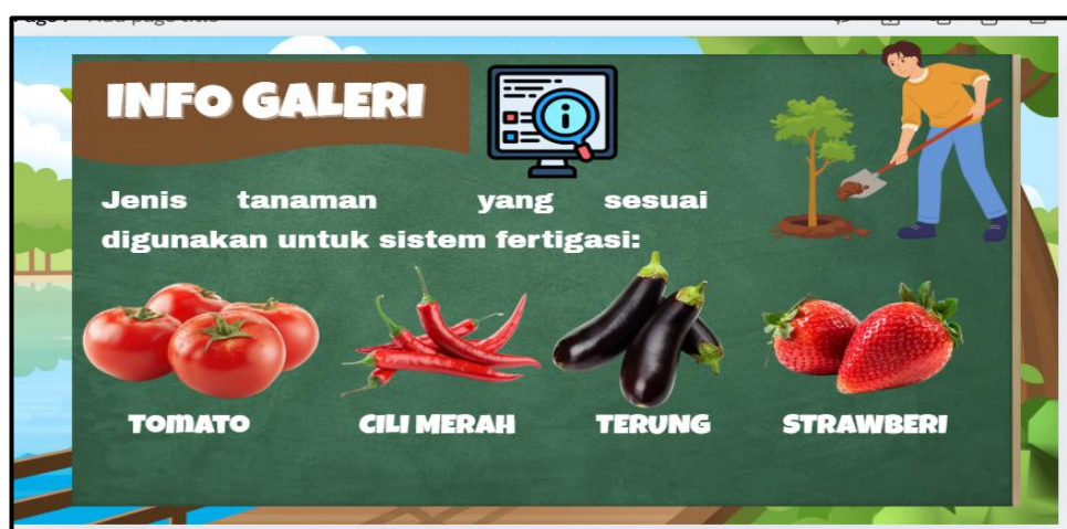
Rajah 5. menunjukkan info galeri dalam E-Modul

Penggunaan gambar realistik komponen, susunan paip dan aplikasi sebenar sistem fertigasi membantu murid mengaitkan teori dengan situasi praktikal. Pendekatan ini selari dengan kajian Rosli dan Rus (2022) yang menyatakan bahawa penggunaan bahan visual dalam pembelajaran fertigasi membantu meningkatkan kefahaman pengguna terhadap sistem dan komponen fertigasi. Selain itu, modul turut mengandungi galeri maklumat tambahan berkaitan sistem fertigasi bagi memperkukuh pembelajaran murid seperti yang ditunjukkan dalam Rajah 5.